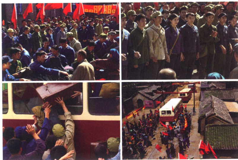
几千名学生正在上汽车离京