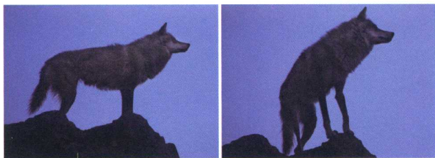
崖顶，强壮的草原狼