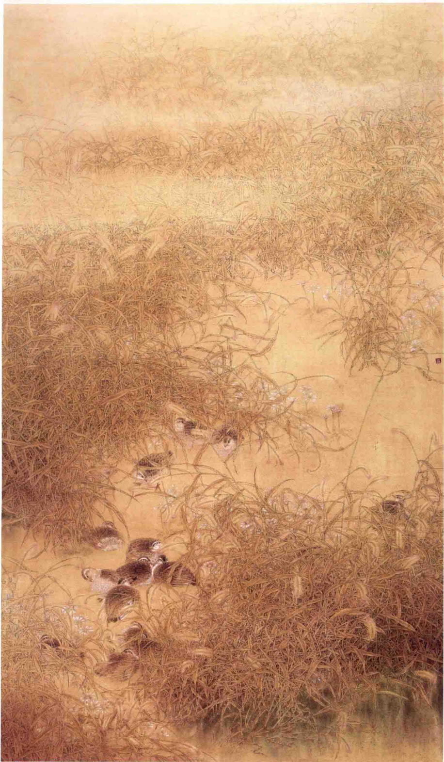
醉滿秋 120cm X 240cm