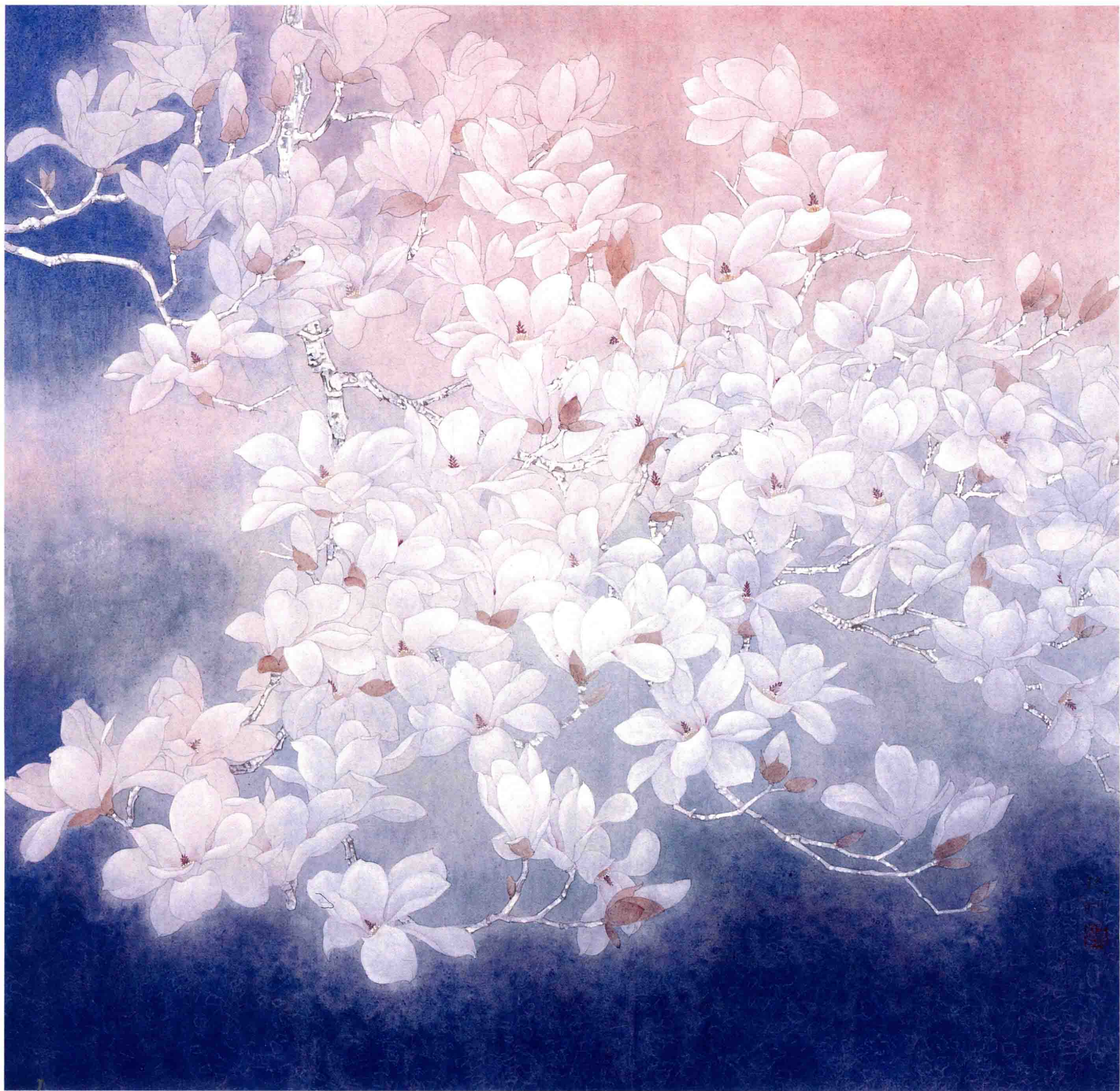
紫气东来 95cm x 95cm