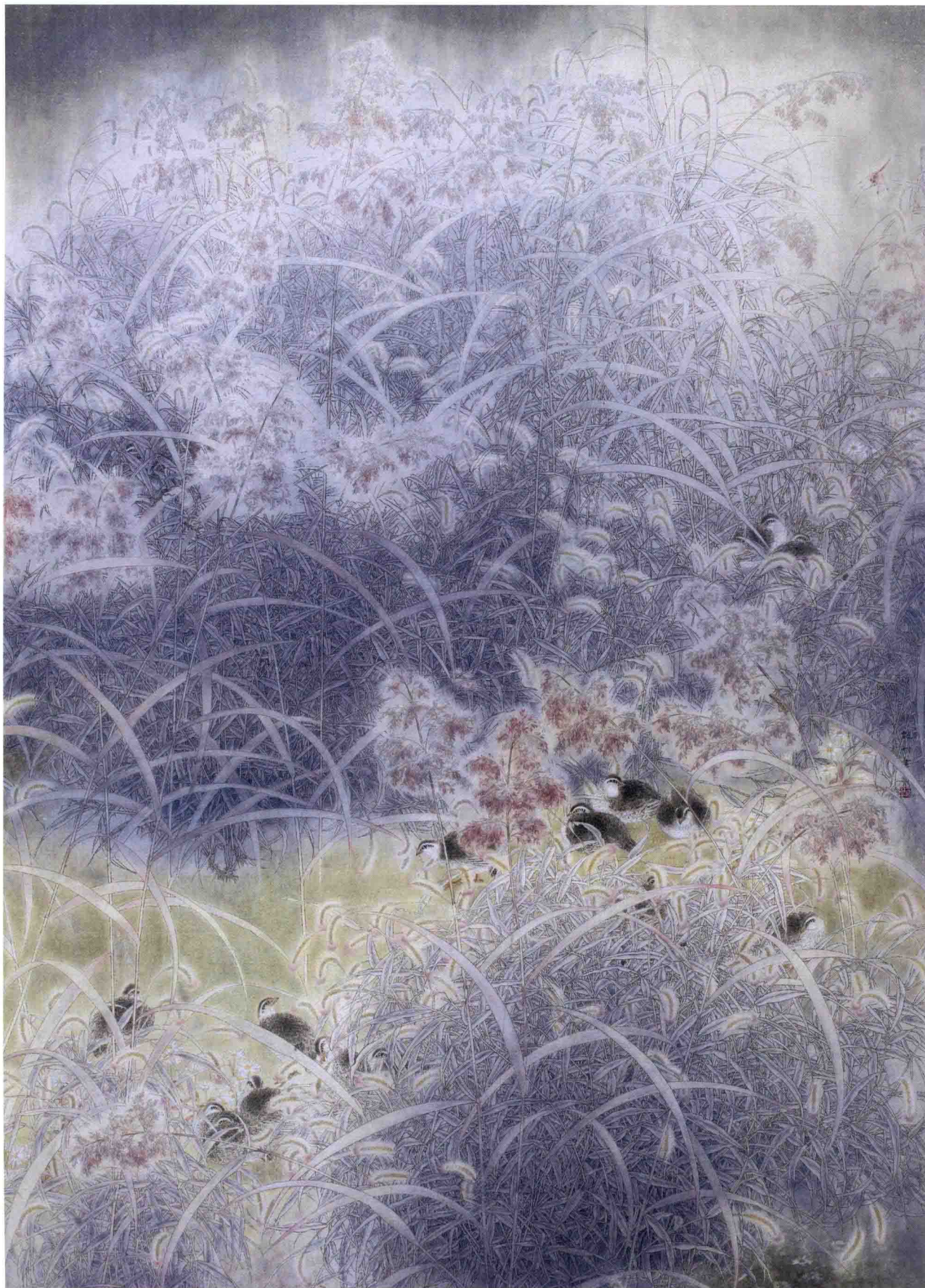
安谧图 160cm × 230cm