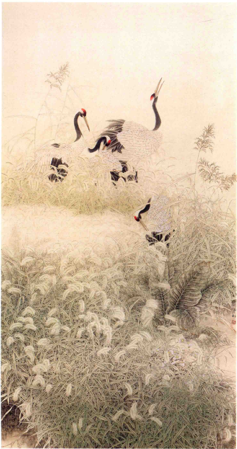
奔原丽影 110cm X 200cm