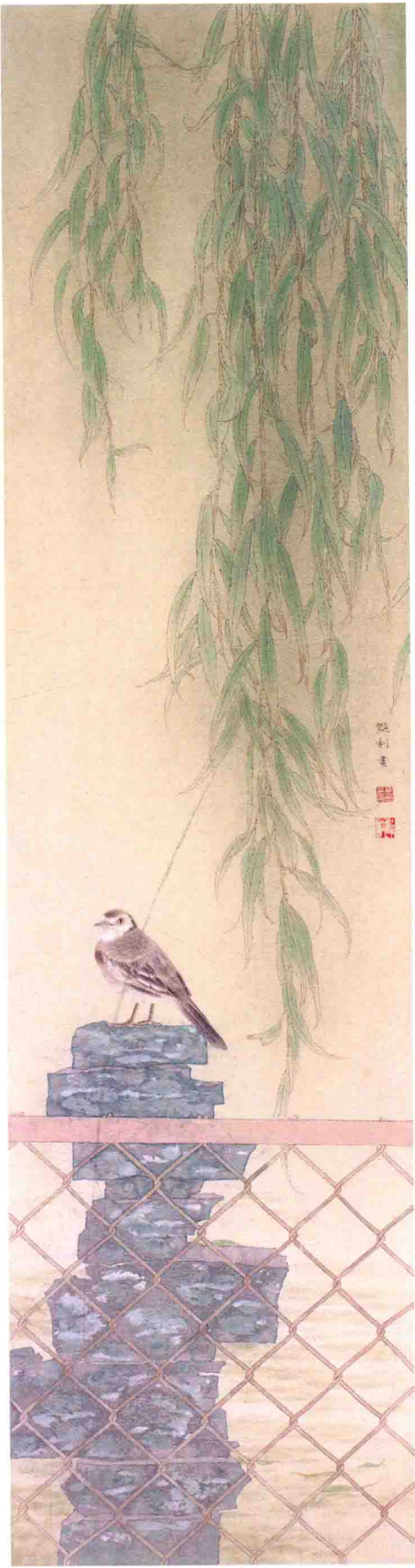
近观春色 静听秋风 33cm X 130cm X 2