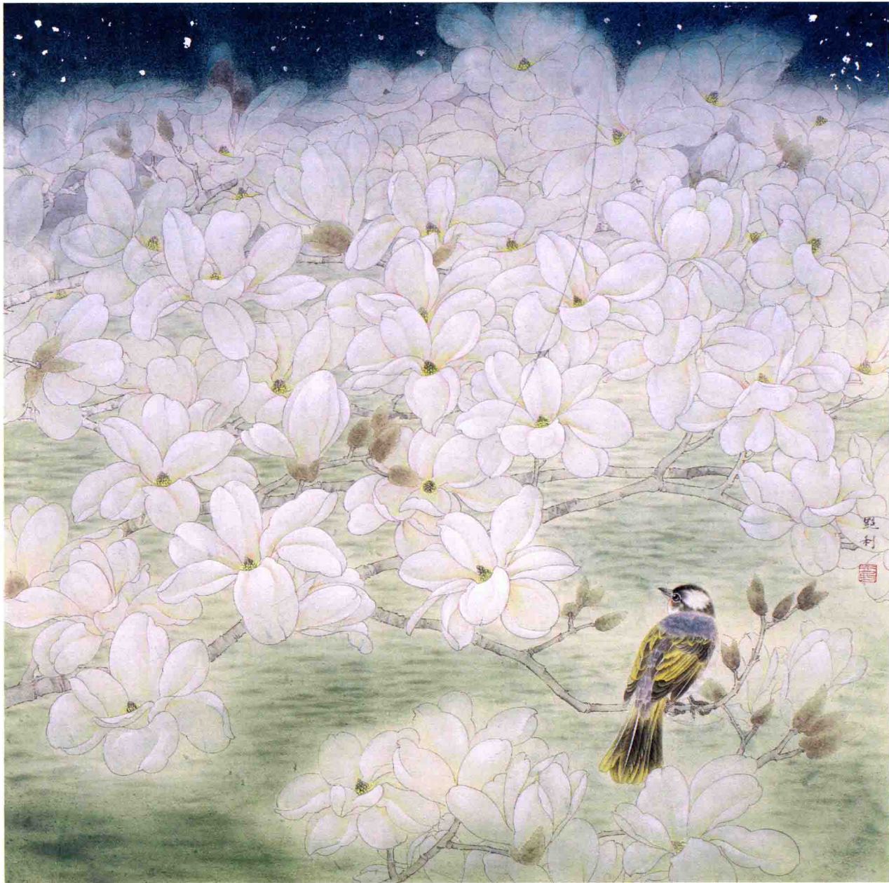
春江花月夜 65cm × 65cm