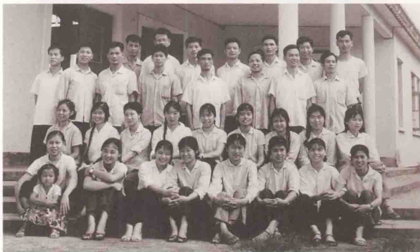
1976年，宝安县文化馆和展览馆的工作人员合影。