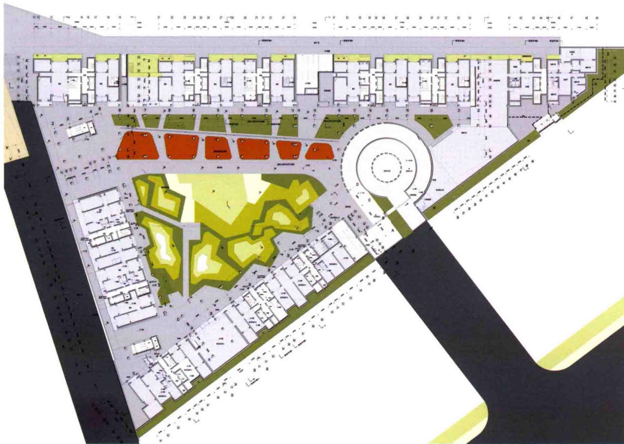
Ground Floor Combination Plan 首层组合平面图