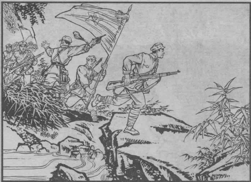
10 正向山寨方向前进的工农红军，听到枪声，循声赶来。