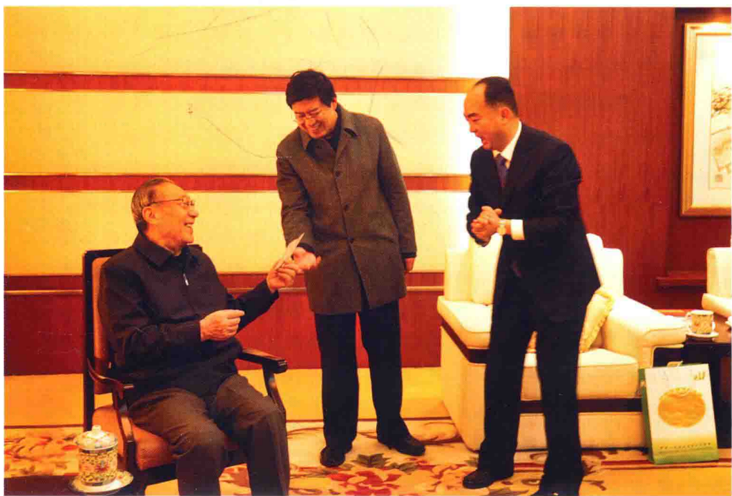
作者在北京向李岚清同志汇报工作