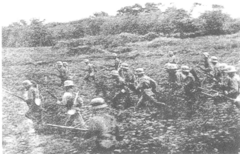
中国军队与日军展开肉搏战