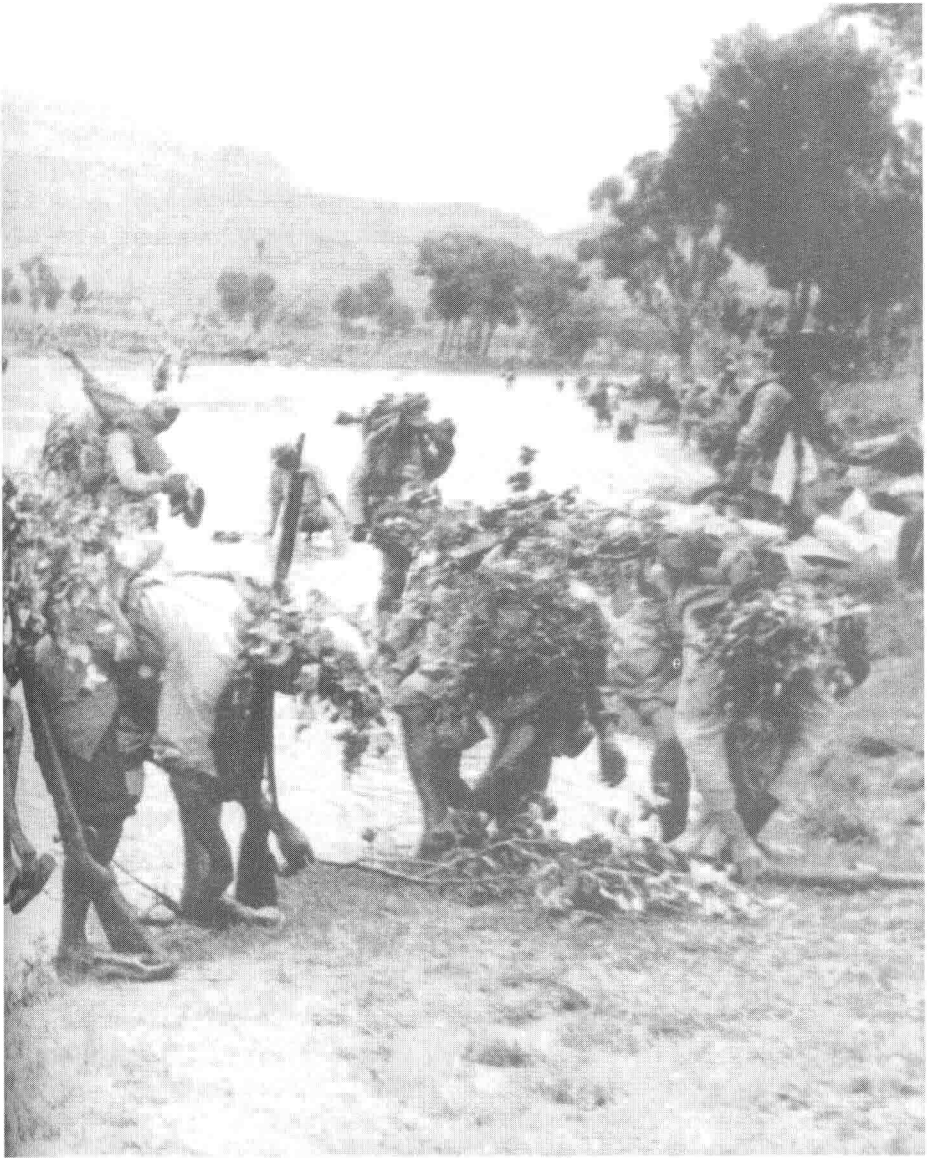
解放战争时期，我军某部涉渡沙河，向晋西南进发