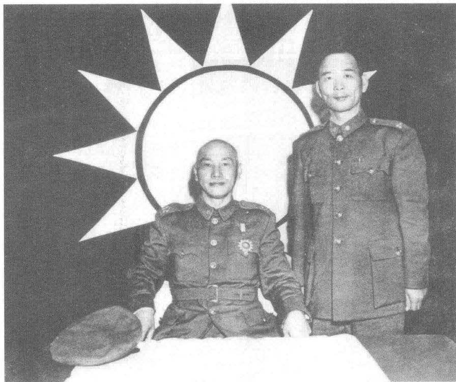
蒋介石视察金门时和胡璉合影