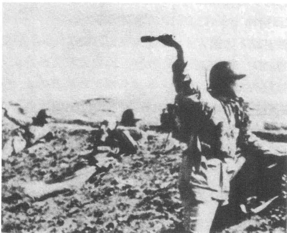
湘西会战中，中国军队士兵正向日军投弹