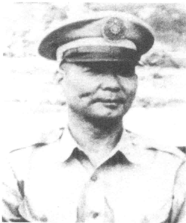
时任 12 兵团副司令官的胡璉