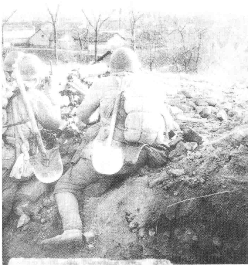
我军重机枪手向洛阳外围之敌射击