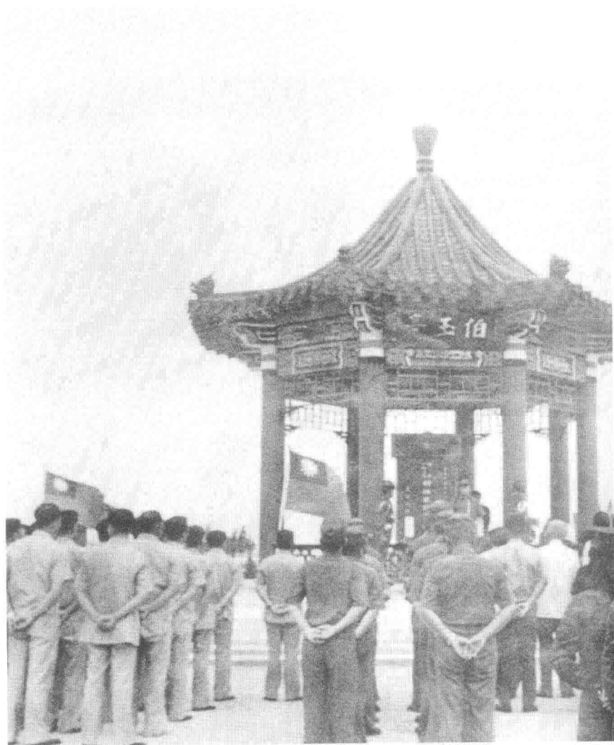
国民党当局在金门为胡璉修建的“伯玉亭”