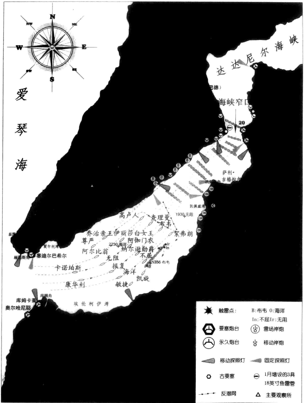
达达尼尔海峡示意图以及 1915 年 3 月 18 日协约国舰队强攻海峡作战图。炮台编号参见下页表。