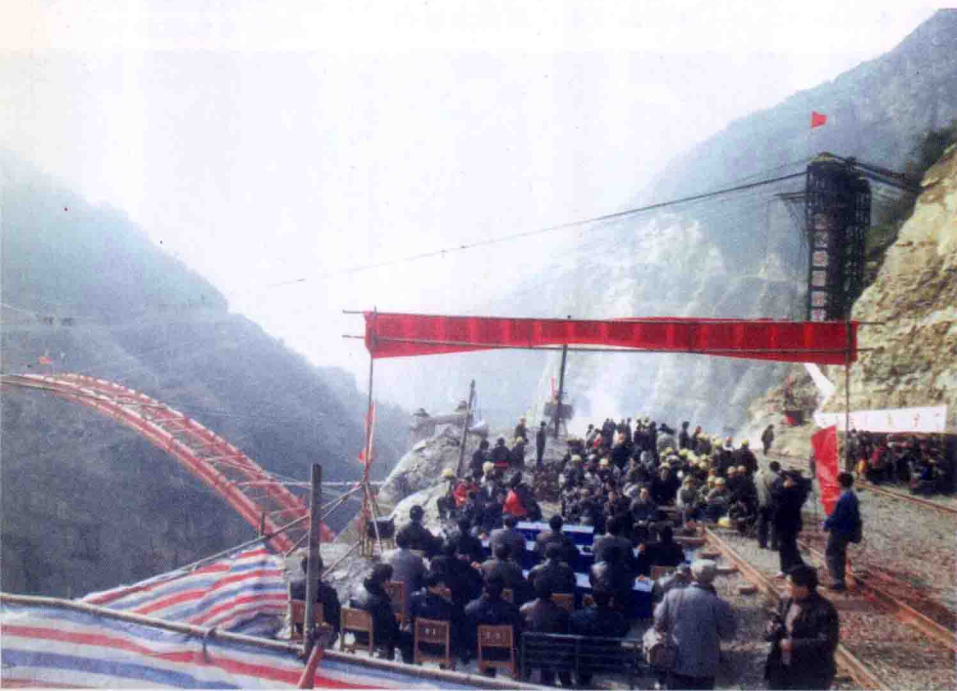
▼ 风茅公路九畹溪特大桥