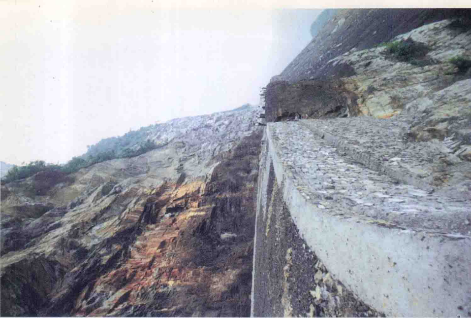
▲ 建设中的秭归江南大通道风茅公路险段处横墩岩