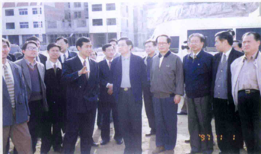
▼ 1997年11月1日，中共中央政治局常委、书记处书记胡锦涛在秭归新县城视察建设中的三峡果品批发市场，听取秭归县常务副县长马学军（前排右二）的汇报。