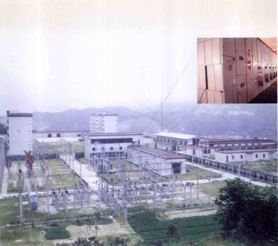
▲ 新建成的茅坪110KV变电站