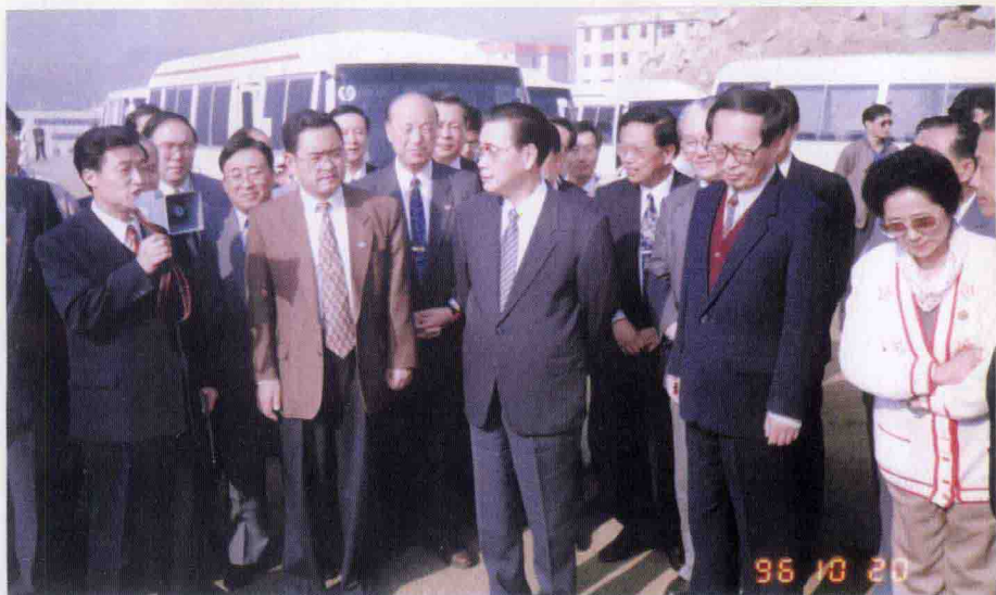
▲ 1996年10月20日，中共中央政治局常委、国务院总理李鹏视察秭归新县城茅坪，县委书记汪元良（前排右二）介绍新县城建设情况。