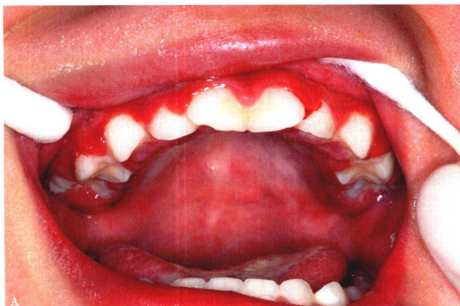
图 1-1-1 A. 牙龈广泛红肿及成簇糜烂