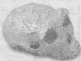
蓝田人猿人复原头骨

陕西是中华文明的发祥地之一，境内有距今 115 万年的蓝田猿人头颅骨化石，距今 18 万年至 20 万年的大荔智人化石和距今 4 万年至 5 万年的河套人遗址。仰韶山文化、龙山文化遗址在这里的分布非常丰富。中华民族的始祖炎帝、黄帝的族居地和陵寝都位于陕西。从公元前 11 世纪开始，先后有 15 个王朝在陕建都，为陕西留下了丰富的历史文物古迹。陕西还是中国革命的摇篮，中国共产党曾在延安 10 年，领导中国人民进行抗日战争和解放战争，留下了许多宝贵的革命遗迹，成为中国爱国主义教育基地之一。