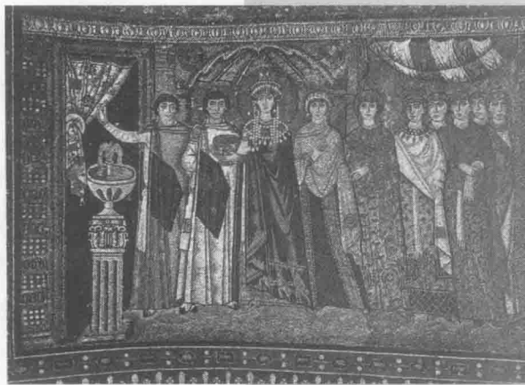
西奥多拉皇后与侍从 546-548 拜占庭