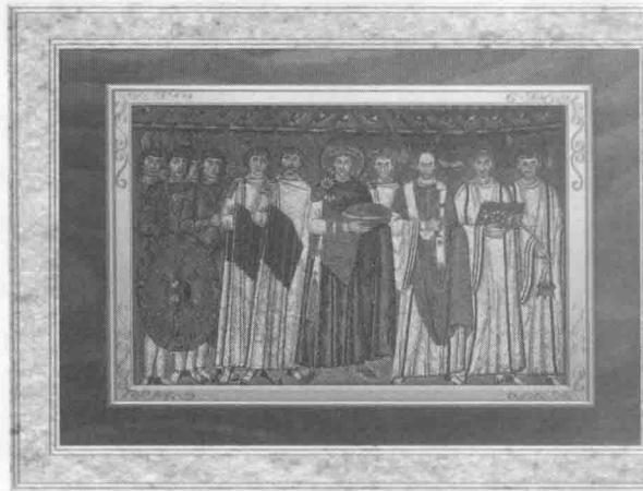
查士丁尼大帝及其随从 546-548 拜占庭