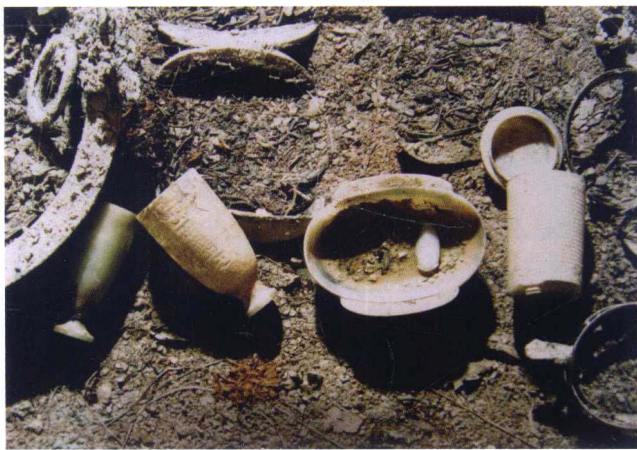
图0-1 徐州狮子山楚王墓W1室出土玉器

近60年来，全国20多个省、市相继出土了大量的汉代玉器，仅南越王墓即出土玉器244件（套），徐州狮子山楚王墓也出土玉器200多件（图0-1）。这些出土玉器数量众多、种类齐全，蔚为大观。