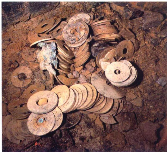
图0-2 南越王墓主棺室“足箱”内出土的陶璧、玉璧 考古发掘玉器出土现场，引自《南越王墓玉器》图版98。