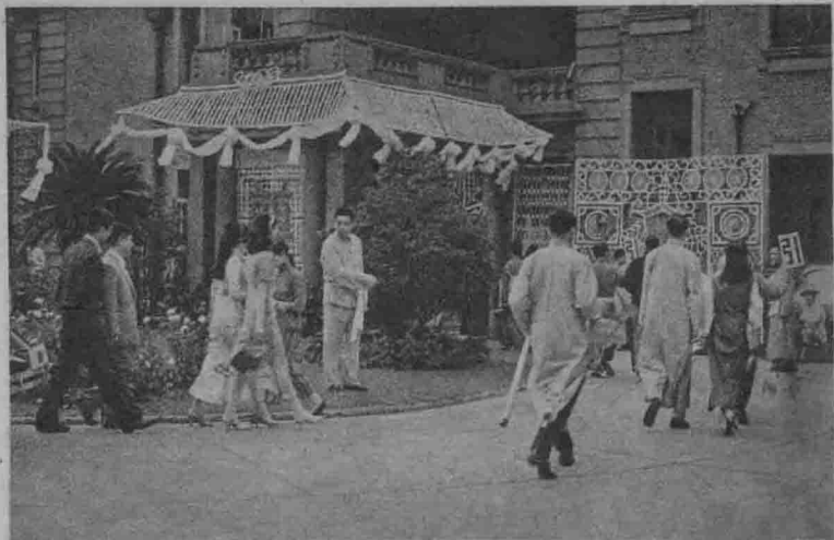
11 吴老太爷开丧的日子,吴公馆内吊客盈门,宾朋满座。 丧事办得十分热闹,但却没有悲哀的气氛。