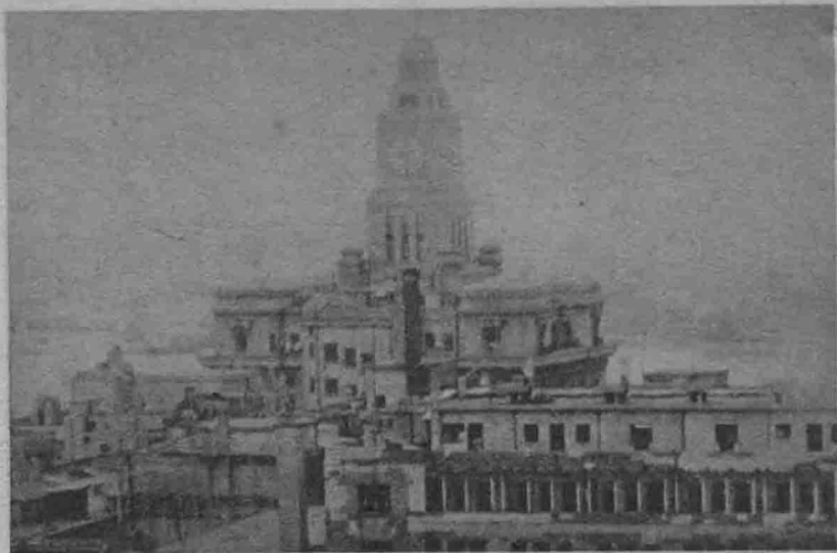
1 一九三〇年春末夏初的上海。可望见英、美、法、日的军舰在黄浦江上耀武扬威地行驶着。