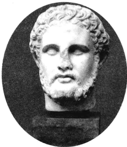
▲马其顿国王腓力塑像

从事针对商人们发放高利贷的人以及拥有大作坊的人，也希望能扩大疆域。那些大作坊，有着上百的奴隶，制造的商品不仅供应本地市场，也面向那些远方城市里的强大市场。