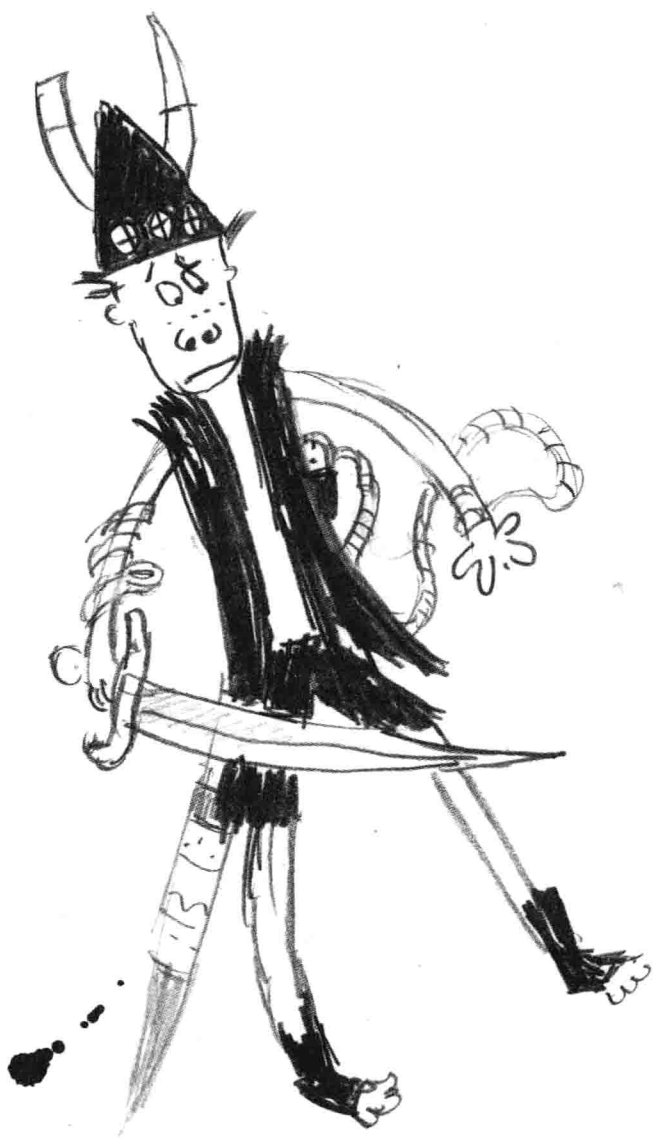
小嗝嗝·霍兰德斯·黑线鳕三世 和他的“奋进剑”