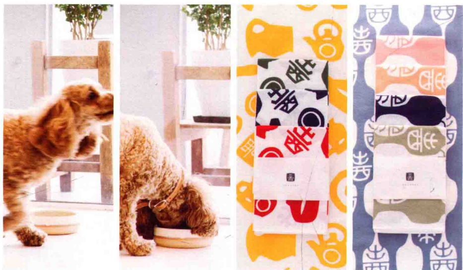
宠物食盘（白）15cm[← 1/2]、出西窑开窑 65 周年纪念手巾 [→ 3/4]