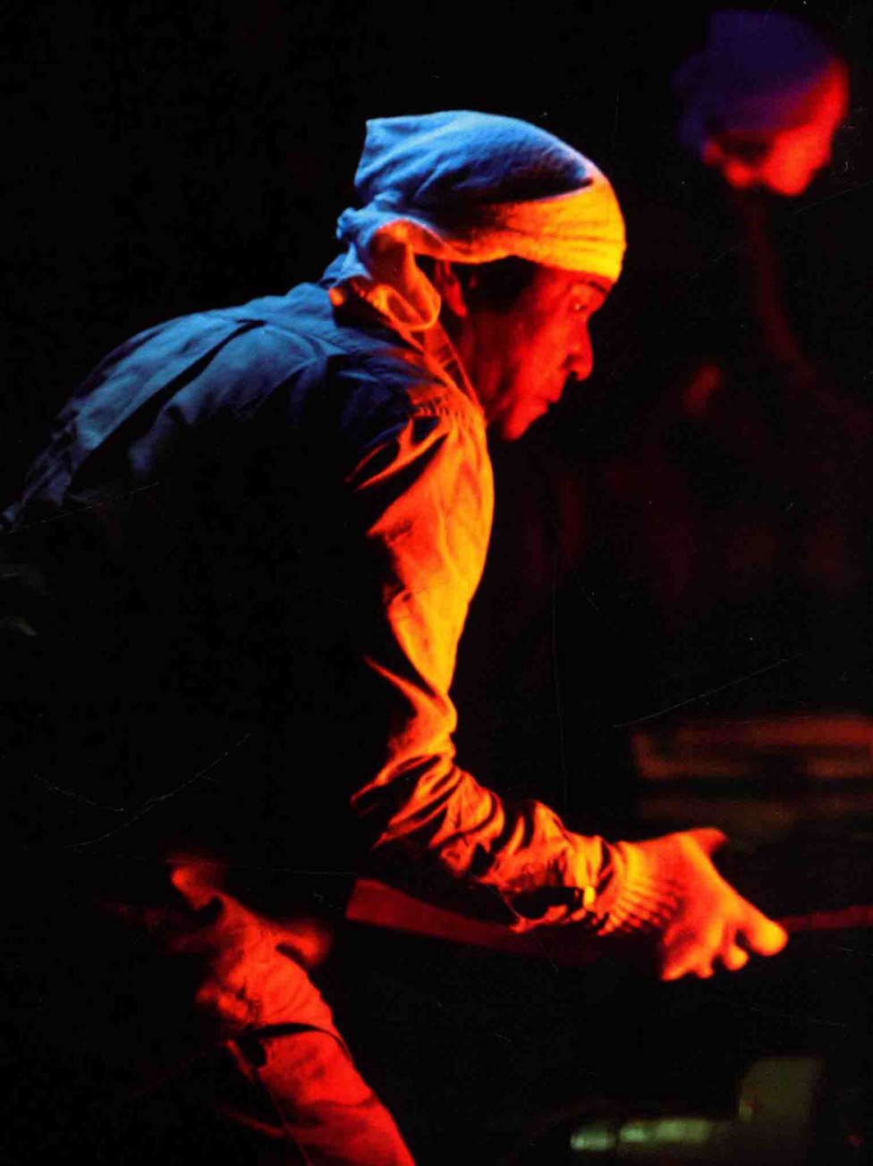
焚烧登窑时的情形