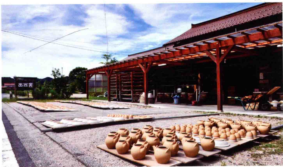
成型的容器露天晾干