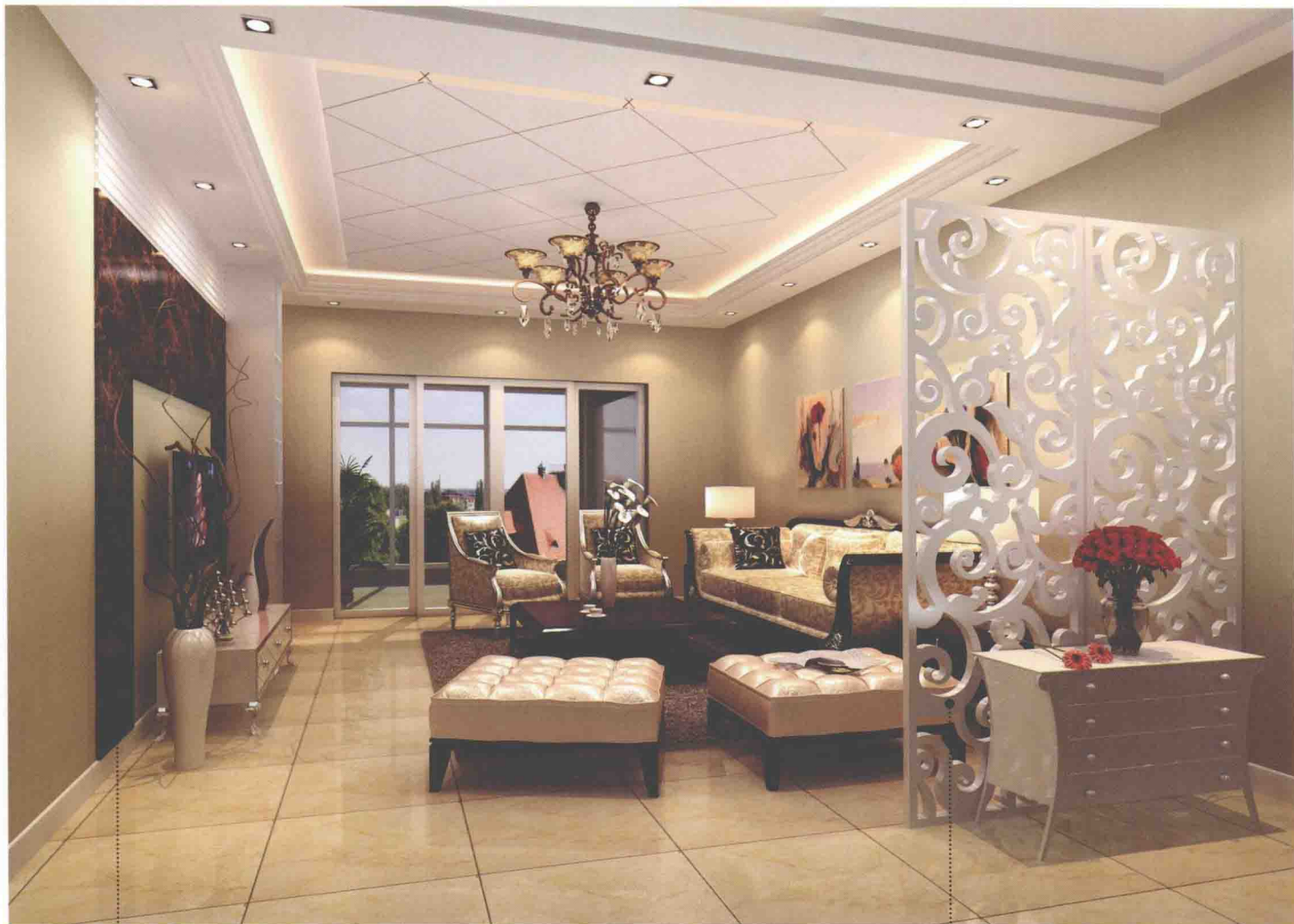
深咖啡色网纹大理石