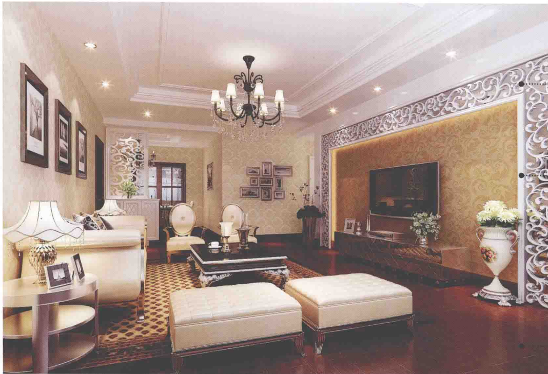
密度板雕花贴银镜