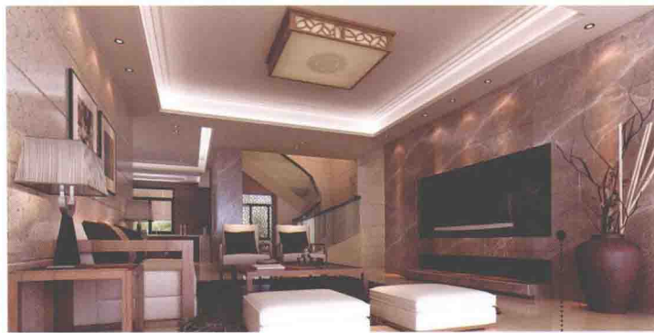
浅咖啡色网纹大理石