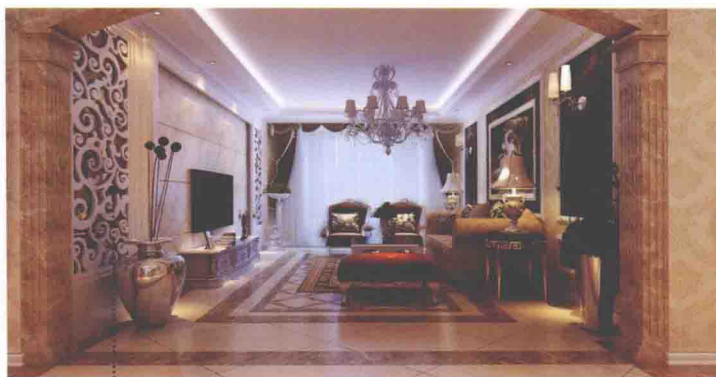
密度板雕花贴茶镜