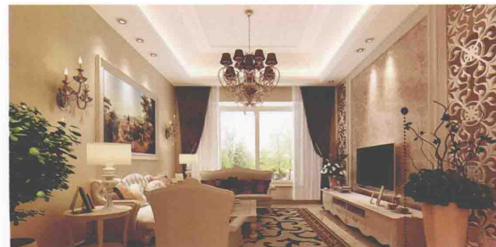
米黄色网纹大理石