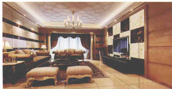
深咖啡色网纹大理石