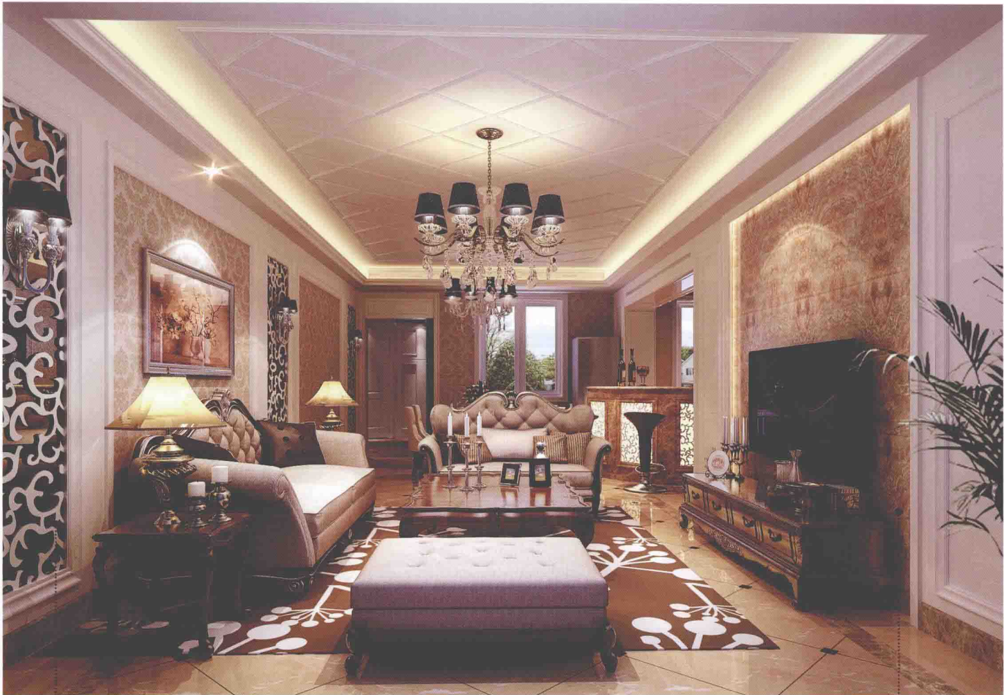
密度板雕花贴灰镜