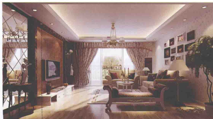
深咖啡色网纹大理石