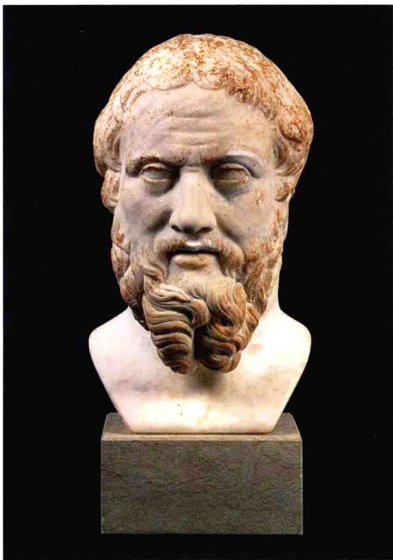
▲ 希腊历史学家希罗多德是希波冲突的记录者。

波斯人追溯自己的起源是来自草原的民族。这是一片辽阔、平坦、几乎没有树木的地区，从中亚一直延伸到东欧地区。这些强大的草原民族