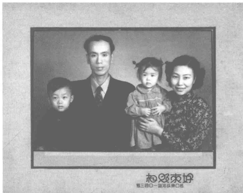
一九五二年，与丈夫和一双儿女摄于上海照相馆。