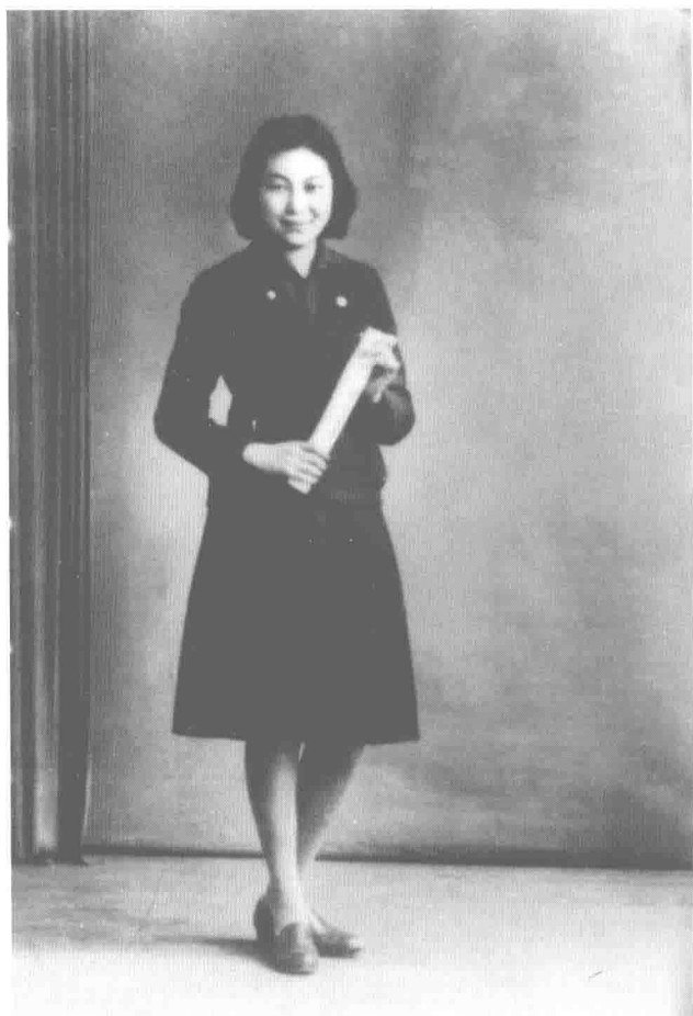
一九四二年，哈尔滨女子高等学校的毕业照。