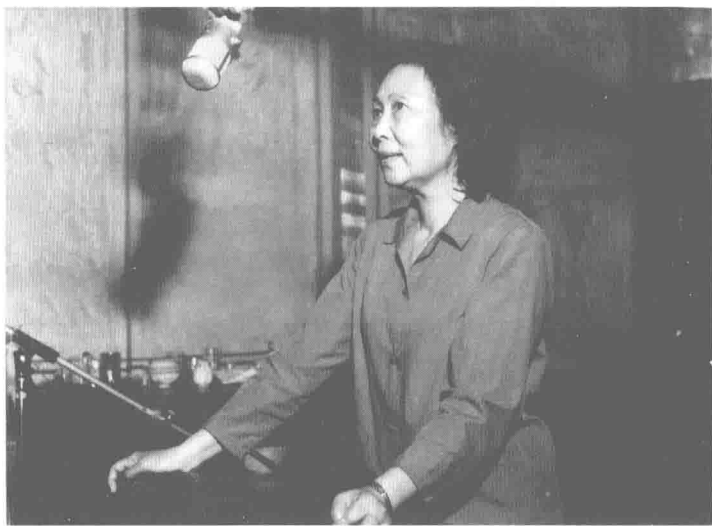
一九八二年，在永嘉路录音棚配音。