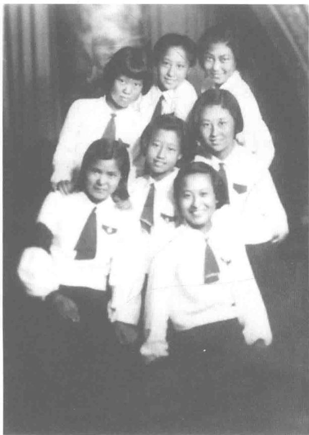
正式毕业前夕，与要好的同学合影留念。