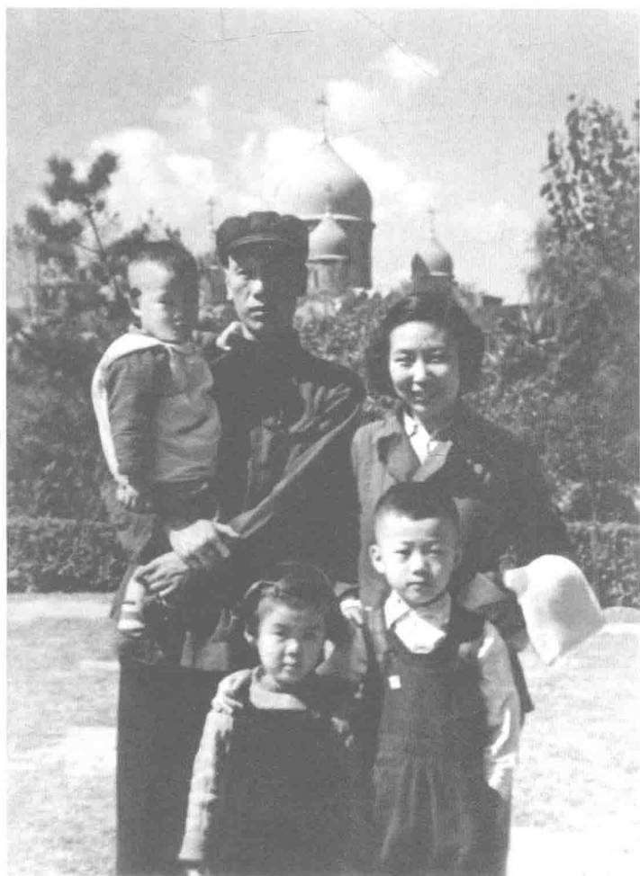
一九五四年的全家福，摄于襄阳公园。