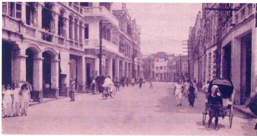
20世纪初期海口的老街道