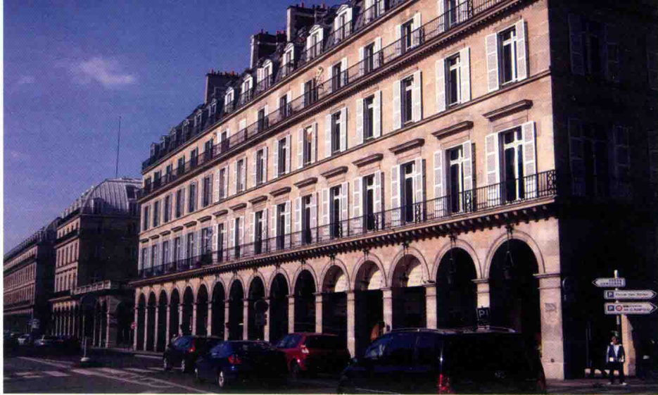
巴黎里沃利骑楼建筑

方资本主义国家的殖民扩张和文化输出，敞廊式建筑走出欧洲，逐渐传到美洲、非洲、亚洲和大洋洲等地。在亚洲，骑楼首先在新加坡等英属殖民地出现，大概在19世纪末经由南亚、东南亚流入中国，传入香港、广州，然后进入广东、广西、海南、福建等广大岭南地区。这一建筑形式进入中国后，与中国的传统建筑相融合，并与当地的地理环境、气候相适应，遂成了今日的骑楼面貌。