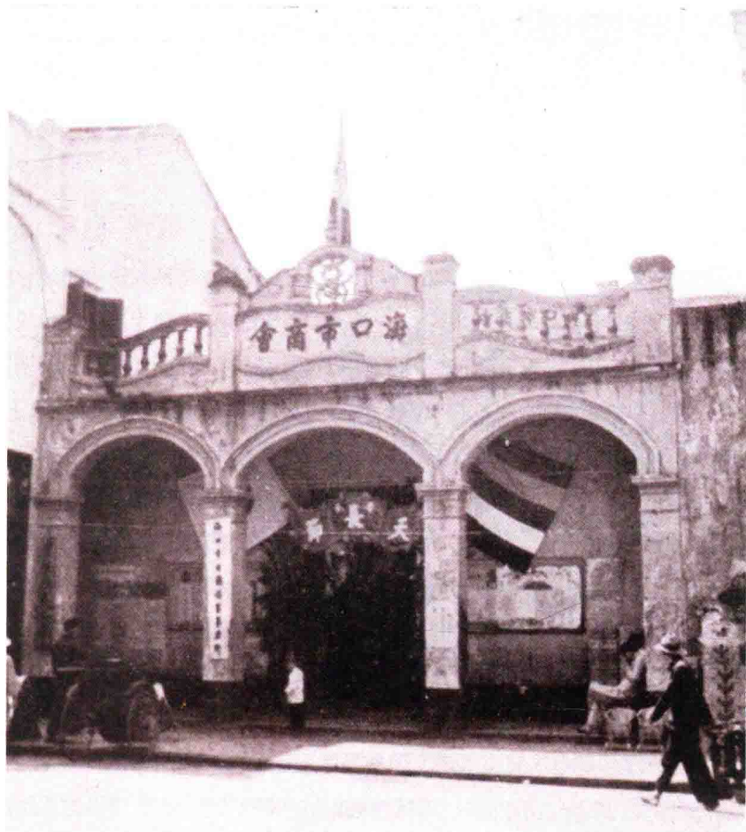
20世纪初期海口市商会