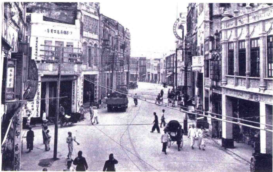
20世纪40年代海口新兴路

骑楼是海南的神韵，见证了海南的百年沧桑，保存和延续着珍贵的城市记忆。追溯它的起源，早在明洪武二十八年（1395年），在海口“外沙”一带（即现在的博爱路、得胜沙路）建造市场街时，已出现了能遮雨防晒的长廊式“排店屋”。到20世纪二三十年代，一股闯南洋风潮在海南刮开，为了生存或生活得更好，东南亚一带出现了不少新的黄色面孔。在海南人的心里，在异乡打出一片天地后，回乡建祖屋是必然的。不少人的足迹停留在“商贾络绎，烟火稠密”的海口，在带回了南洋思想的同时，也让海南多出了不少南洋风格的建筑。据说，这些骑楼所用的材料还是从东南亚一船船运回来的。这些南洋骑楼给海口带来别样的风情，也带来别样的浪