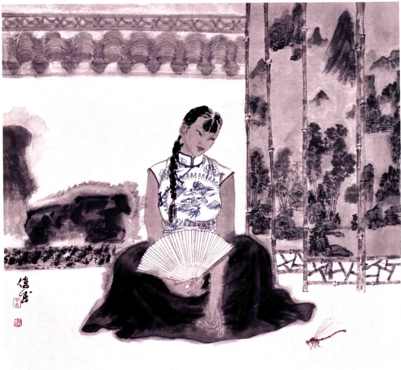
庭院深深之三 68cm × 68cm 纸本