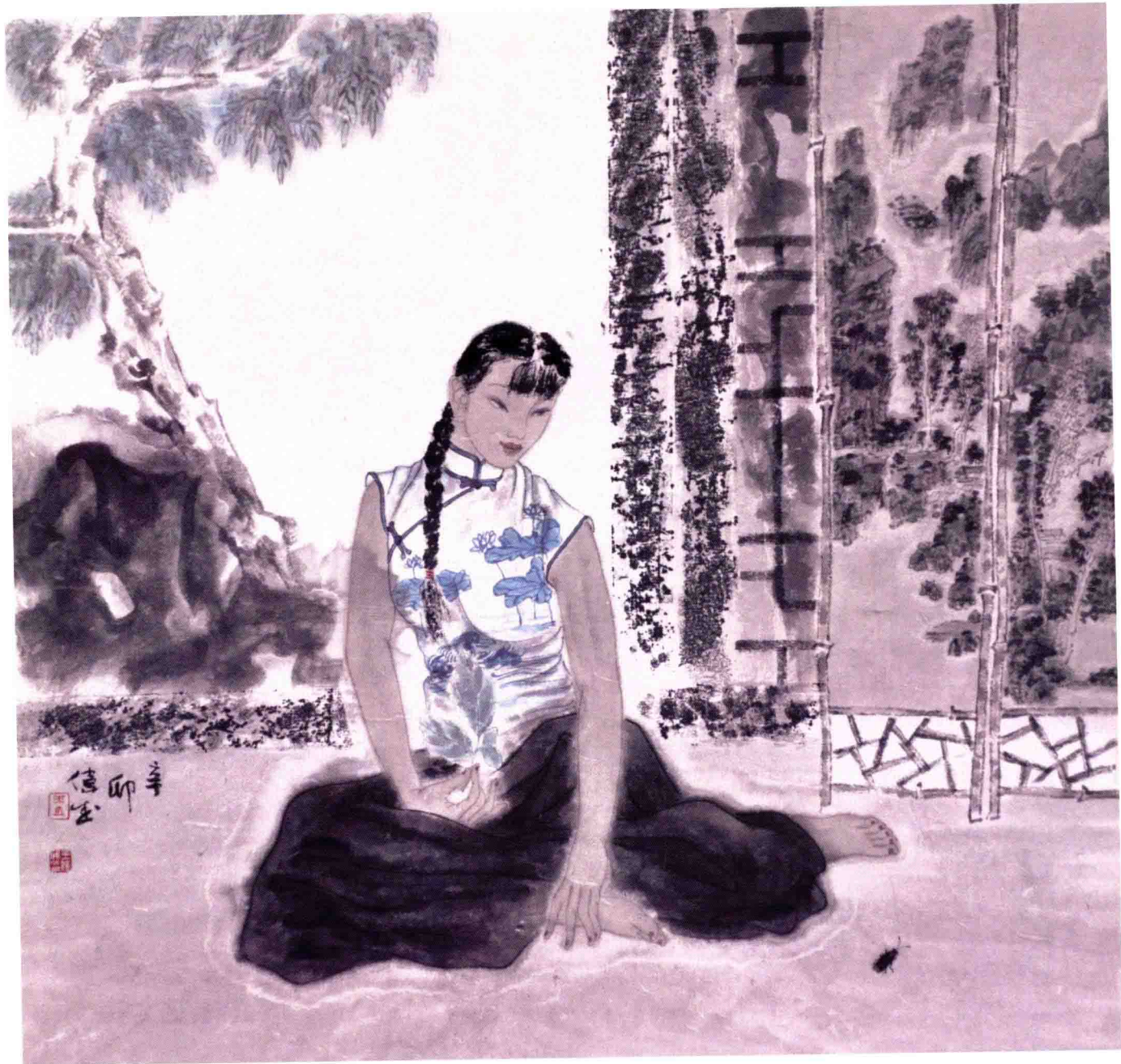
庭院深深之九 68cm × 68cm 纸本