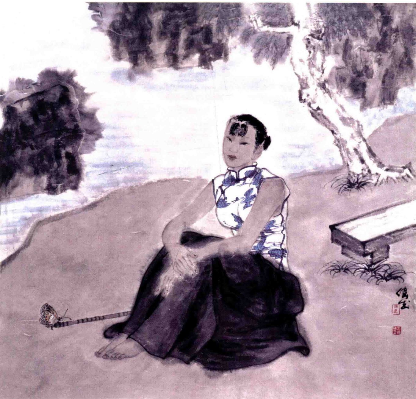
庭院深深之八 68cm × 68cm 纸本