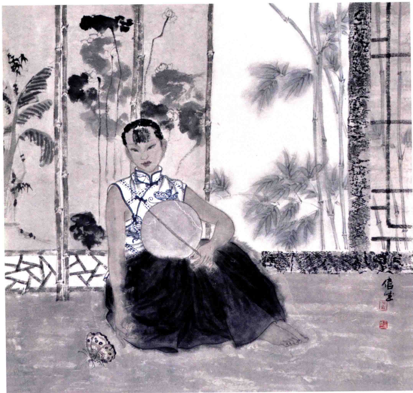
庭院深深之一 68cm × 68cm 纸本