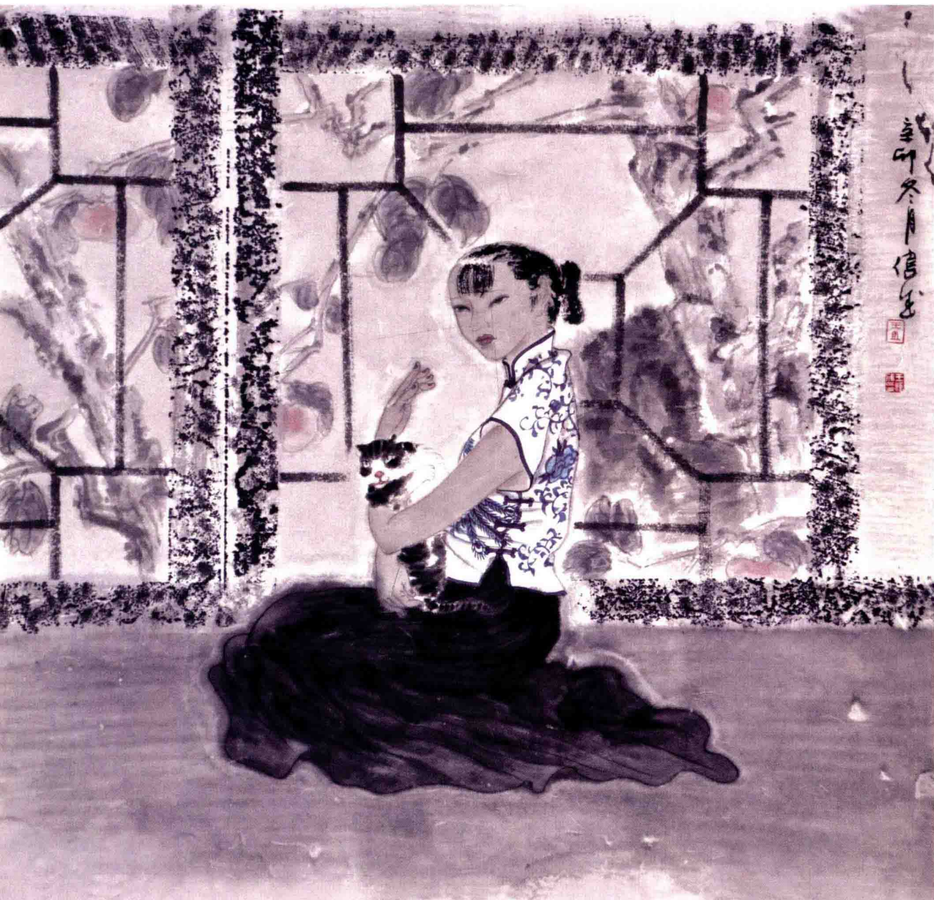
庭院深深之四 68cm x 68cm 纸本