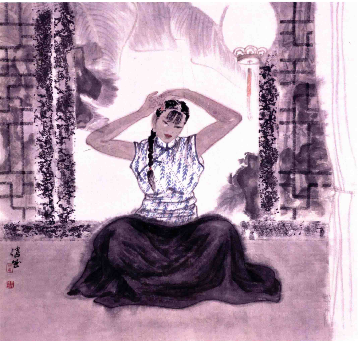
庭院深深之二 68cm×68cm 纸本