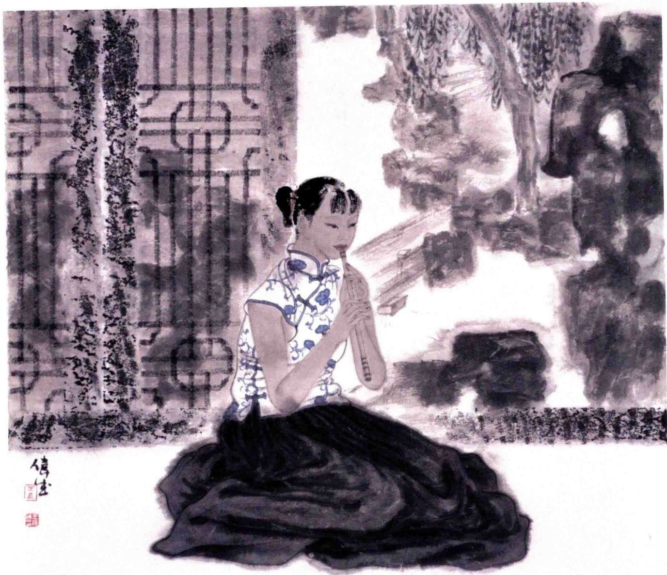
庭院深深之七 68cm × 68cm 纸本