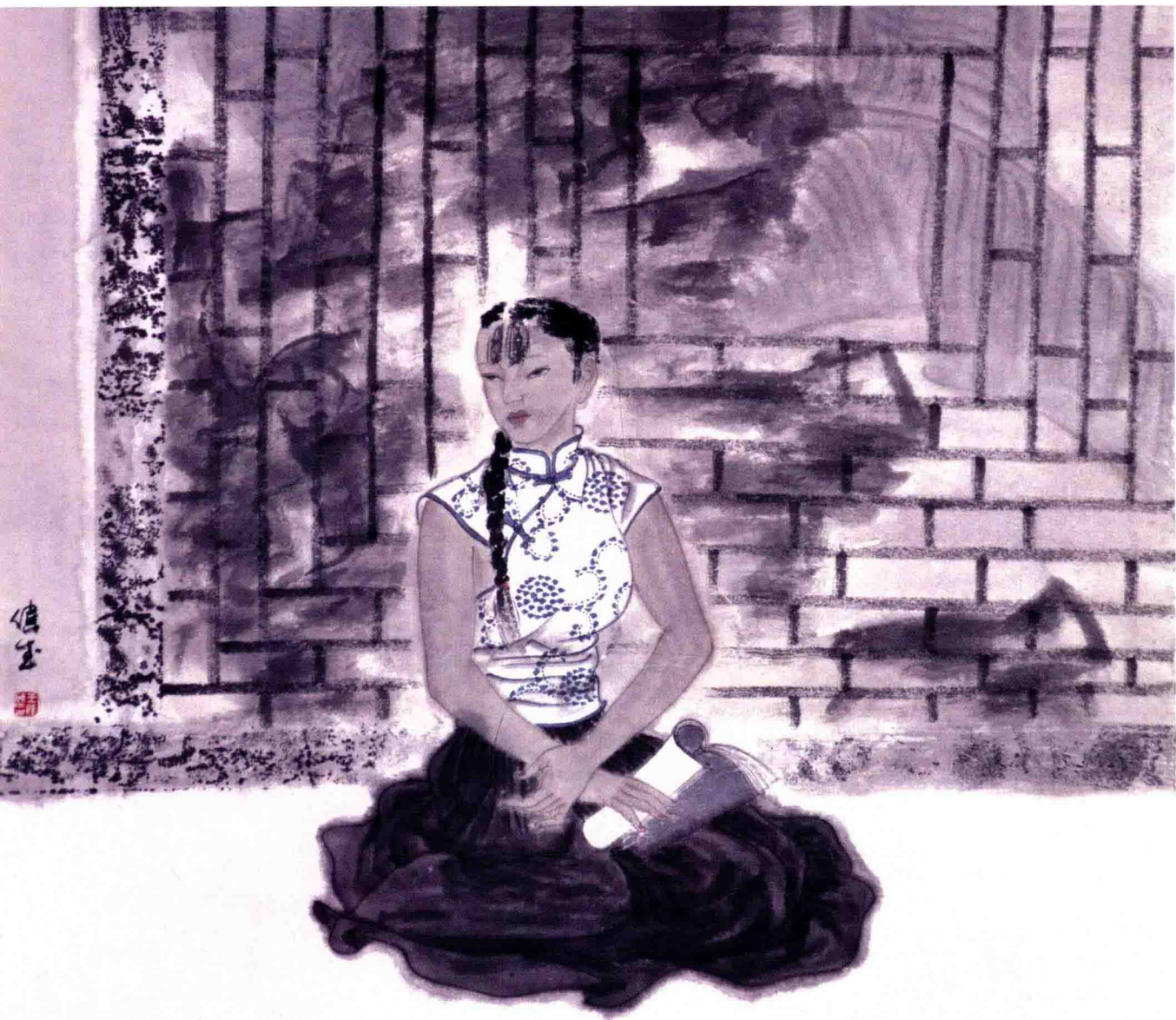
庭院深深之六 68cm × 68cm 纸本