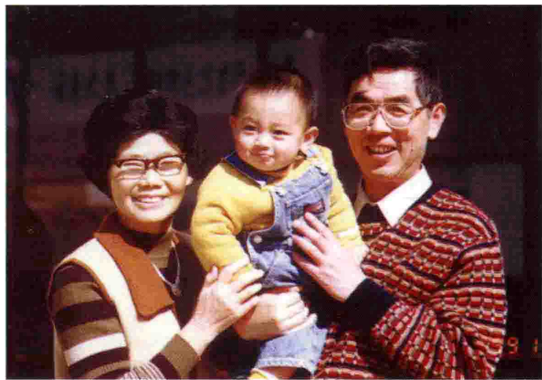
作者与夫人、小孙子在一起