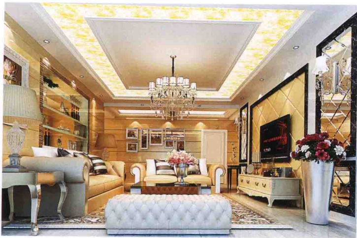
沙发墙：木搁板 + 米黄大理石