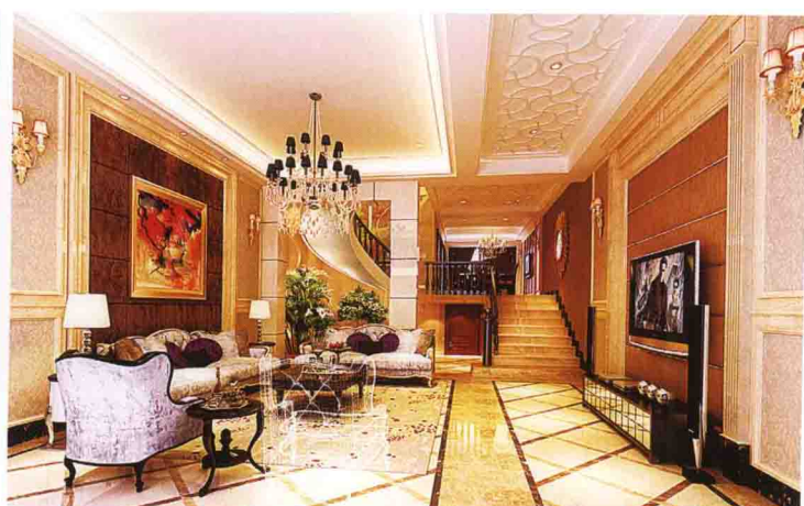
沙发墙：布艺软包 + 墙纸 + 大理石线条收口