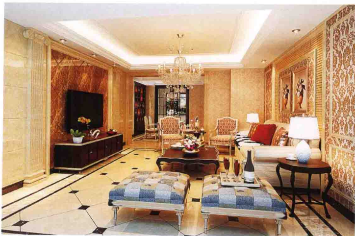
沙发墙：墙纸 + 陶瓷马赛克 + 木线条框