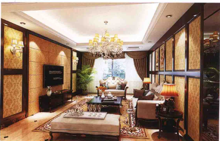
沙发墙：墙纸 + 木线条框