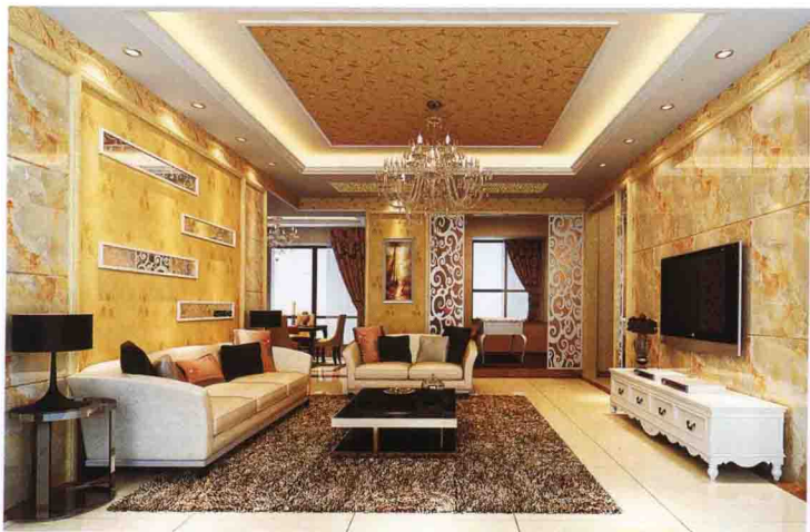
沙发墙：墙纸 + 雕花银镜 + 木线条收口