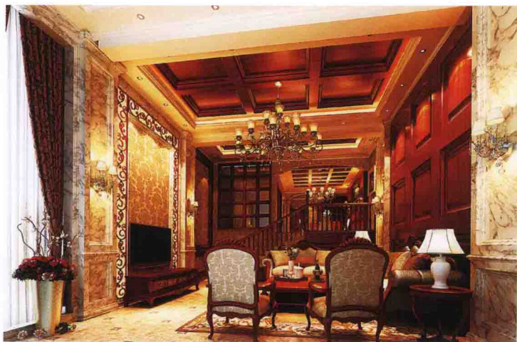
沙发墙：樱桃木饰面板装饰凹凸背景 + 大花白大理石