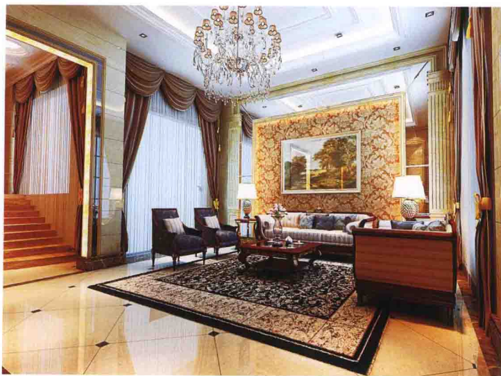
沙发墙：墙纸 + 银镜 + 大理石罗马柱