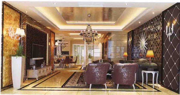
沙发墙：墙纸 + 布艺软包 + 木线条收口