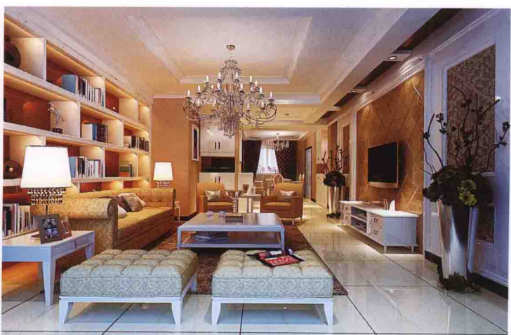
沙发墙：饰面板装饰柜 + 茶镜