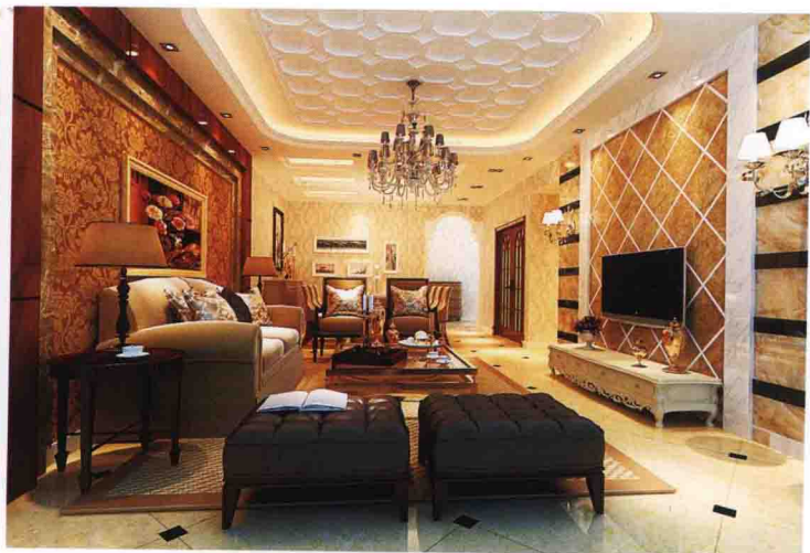
沙发墙：墙纸 + 啡网纹大理石线条收口 + 柚木饰面板