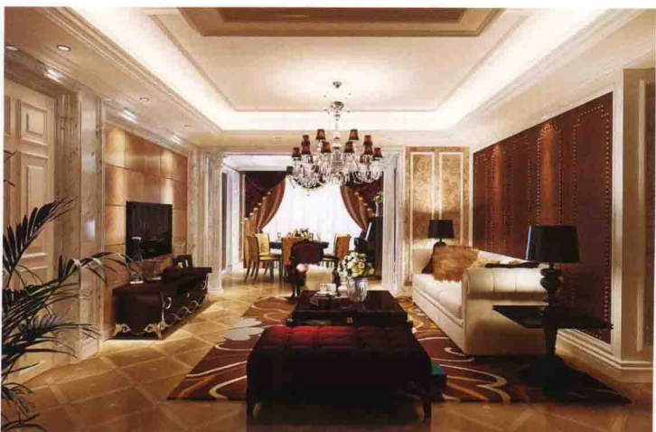
沙发墙：皮质软包 + 木线条收口