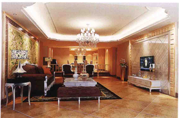
沙发墙：真丝手绘墙纸 + 陶瓷马赛克 + 大理石线条收口