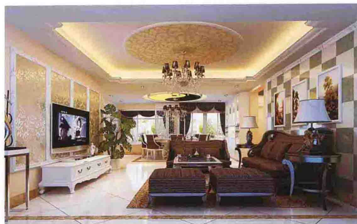
沙发墙：双色仿古砖相间铺贴 + 大理石线条收口