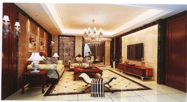
沙发墙：布艺软包 + 花梨木饰面板装饰凹凸背景