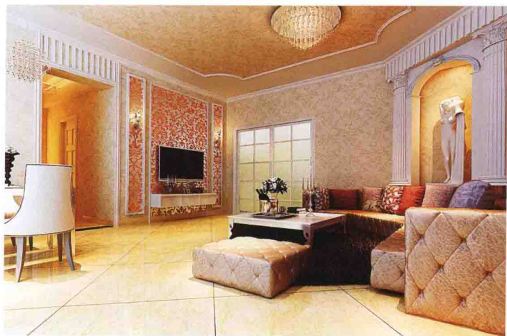
沙发墙：墙纸 + 石膏罗马柱