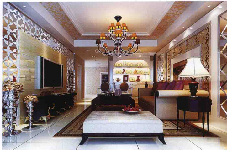
电视墙：金属马赛克 + 银镜倒 45° 角