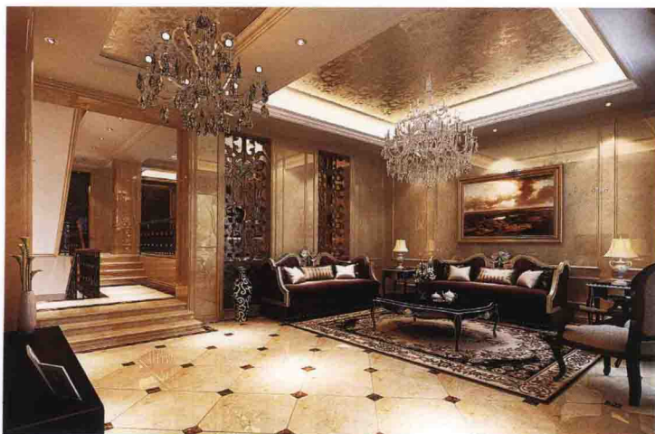
沙发墙：米白大理石