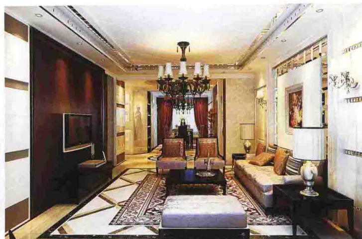
沙发墙：爵士白大理石 + 银镜倒角 + 金属马赛克