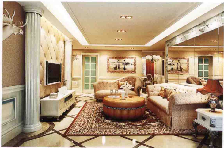
沙发墙：银镜 + 大花白大理石线条收口