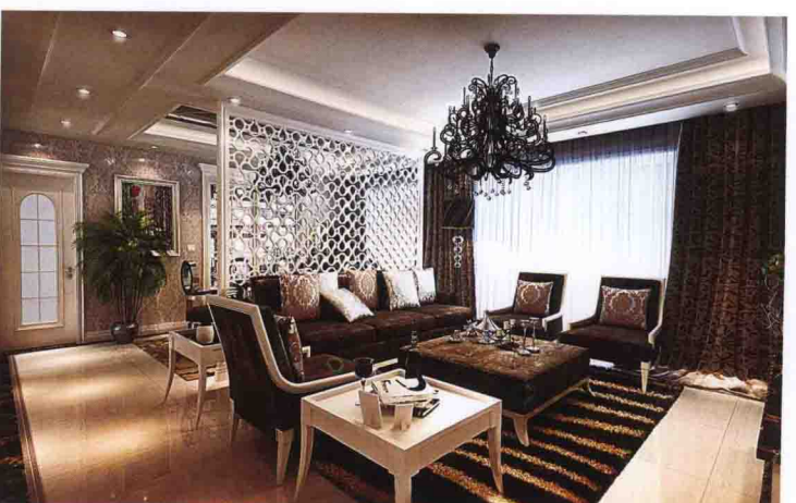
沙发墙：密度板雕刻刷白