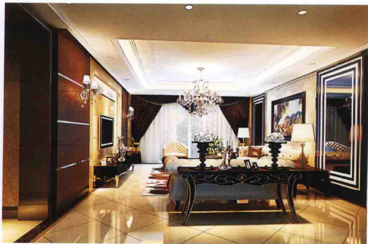
沙发墙：墙纸 + 灰镜