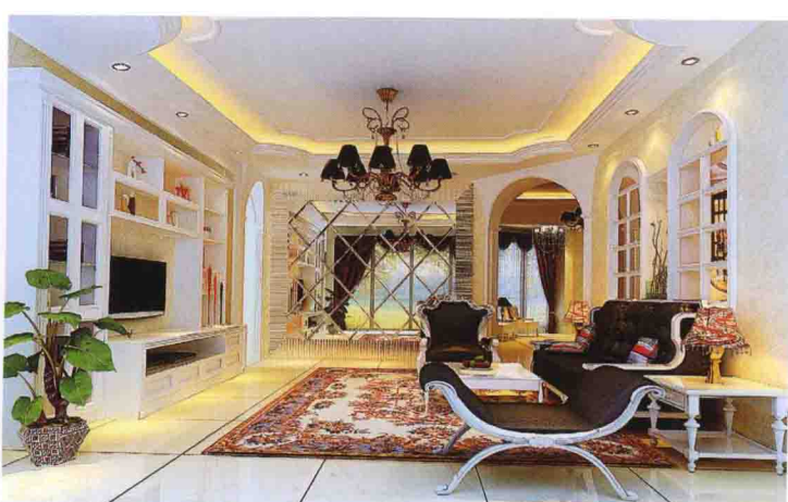
沙发墙：墙纸 + 装饰窗