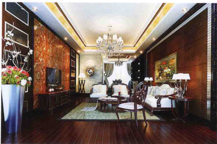
沙发墙：皮质软包 + 金属马赛克 + 大理石线条收口