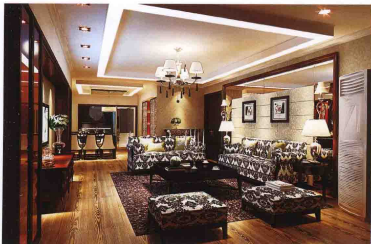
沙发墙：布艺软包 + 银镜 + 实木线装饰套