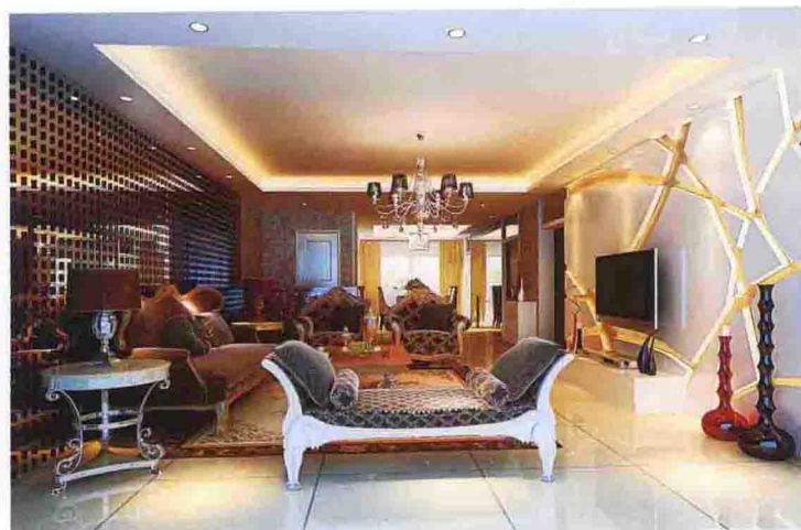
沙发墙：木格栅喷漆银漆