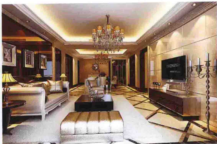
沙发墙：茶镜 + 大理石线条收口