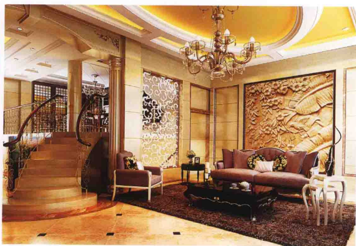
沙发墙：砂岩浮雕 + 米黄大理石