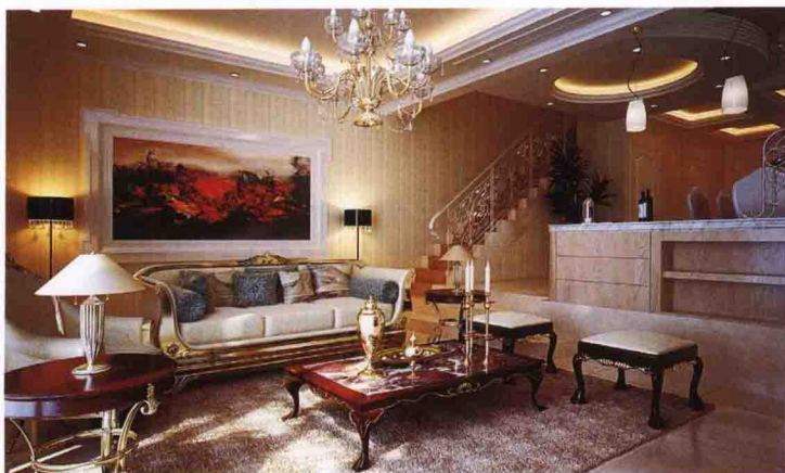
沙发墙：墙纸 + 装饰画