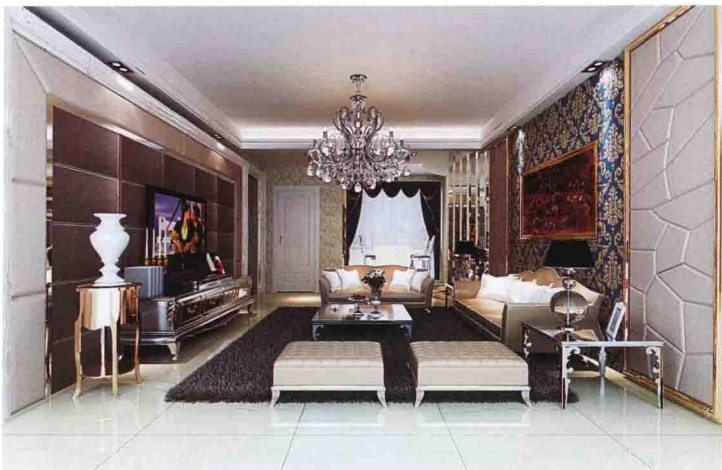
沙发墙：墙纸 + 布艺软包 + 木线条喷金漆收口