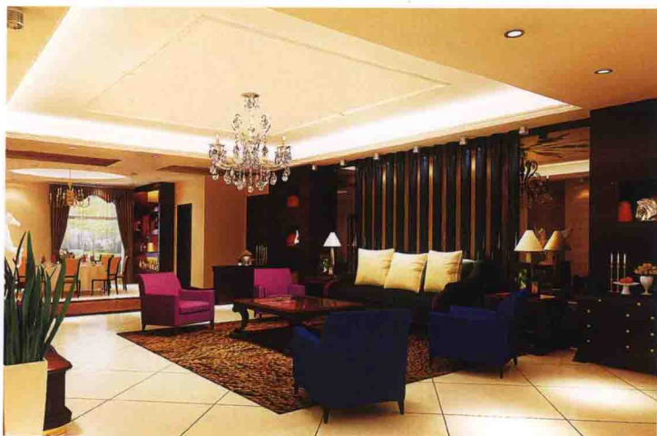
沙发墙：半圆装饰柱 + 银镜 + 樱桃木饰面板