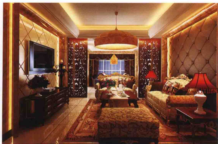
沙发墙：布艺软包 + 大理石线条收口