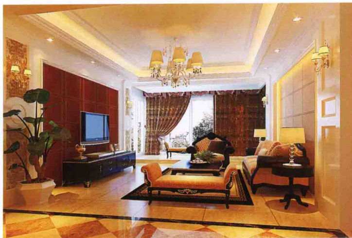
沙发墙：皮纹砖 + 饰面板装饰凹凸背景刷白