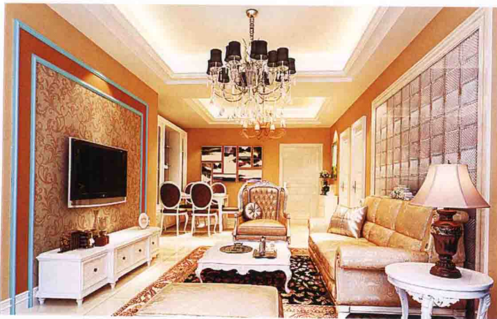
沙发墙：布艺软包 + 实木线装饰套 + 彩色乳胶漆