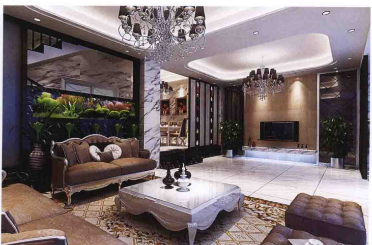
沙发墙：黑白根大理石 + 工艺鱼缸 + 大花白大理石