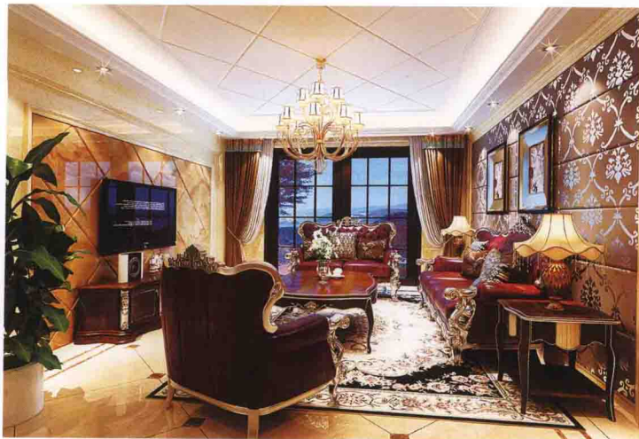
沙发墙：布艺软包 + 大理石线条收口