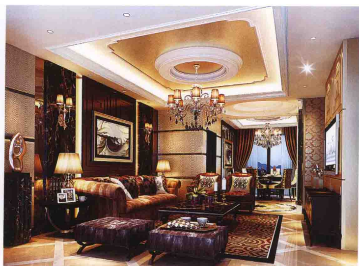
沙发墙：回纹线条木雕 + 啡网纹大理石 + 灰镜 + 皮质软包