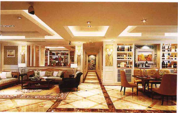
沙发墙：杉木板装饰凹凸背景刷白 + 墙纸