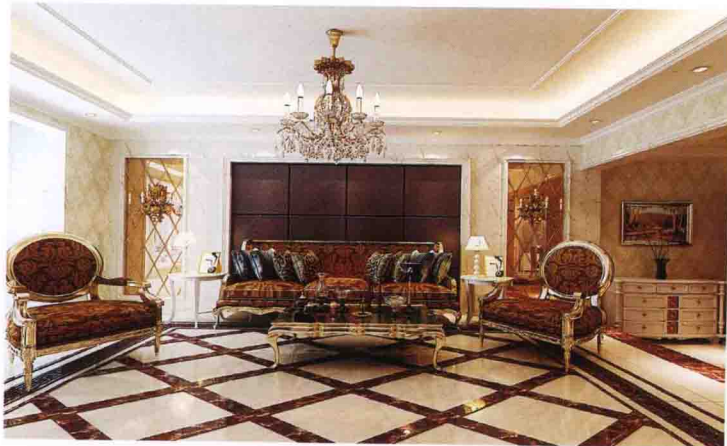
沙发墙：皮质软包 + 茶镜拼菱形 + 爵士白大理石