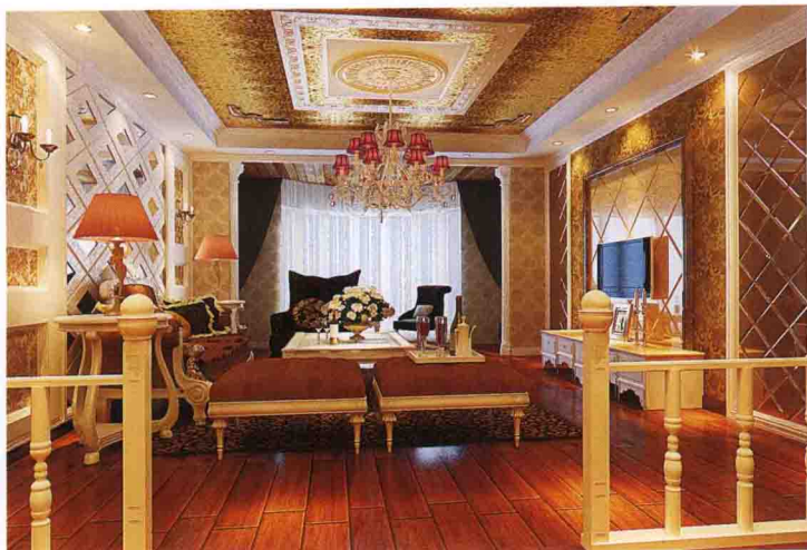
沙发墙：银镜 + 木线条打菱形框 + 墙纸 + 饰面装饰框刷白