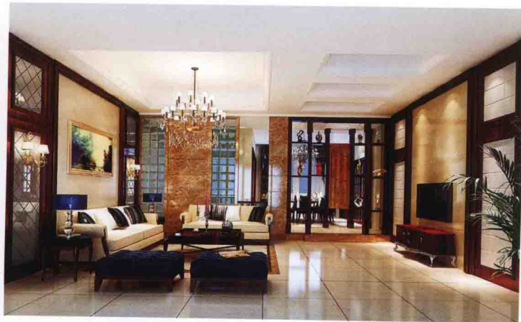
沙发墙：墙纸 + 灰镜拼菱形 + 木线条框