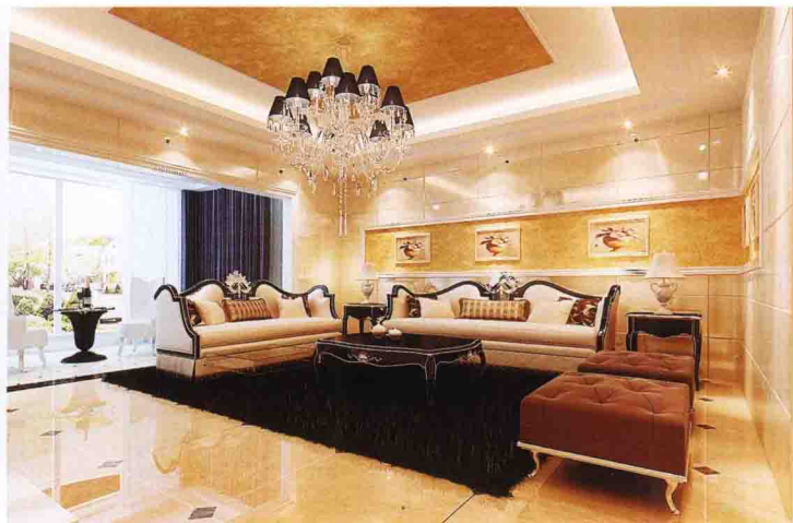
沙发墙：米黄大理石 + 墙纸 + 实木线装饰套