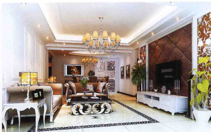
沙发墙：饰面板装饰凹凸背景刷白