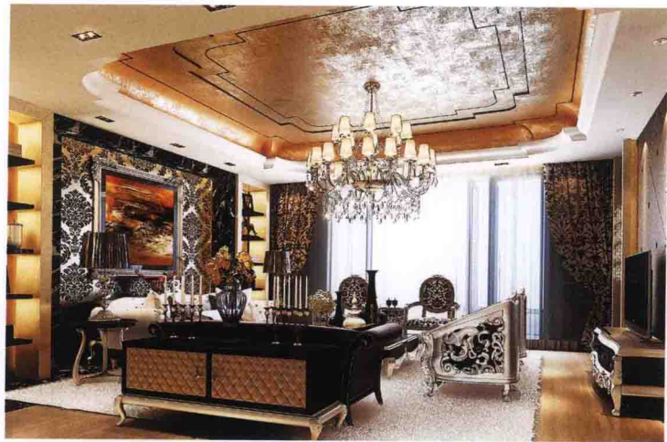
沙发墙：墙纸 + 黑白根大理石框 + 木搁板