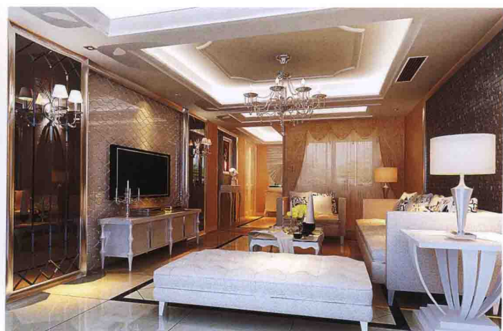
沙发墙：陶瓷马赛克