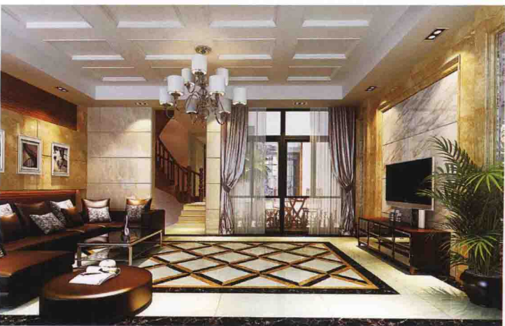
沙发墙：米黄大理石 + 木线条密排