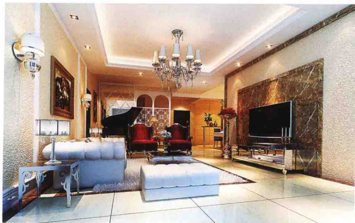
沙发墙：质感艺术漆 + 木线条框