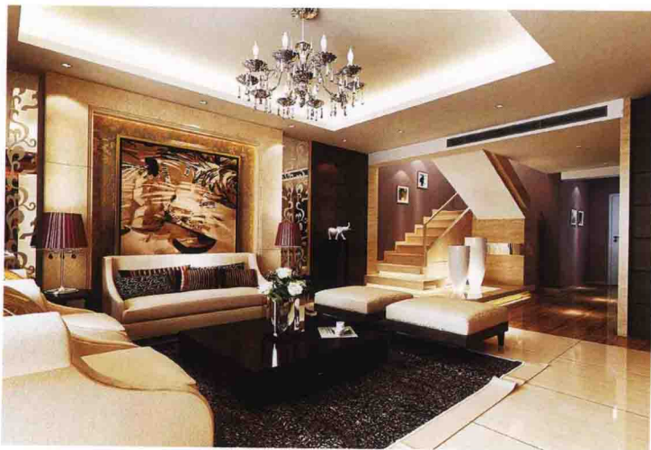
沙发墙：陶瓷马赛克拼花 + 米黄大理石 + 磨花银镜