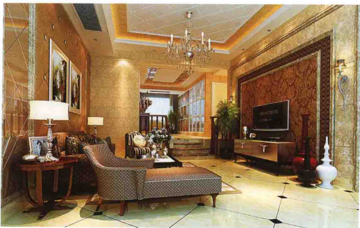
沙发墙：皮质软包 + 茶镜拼菱形