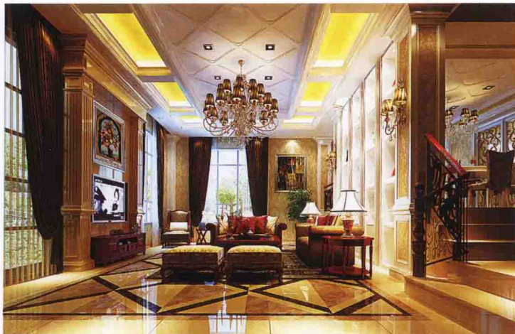
沙发墙：饰面板装饰柜