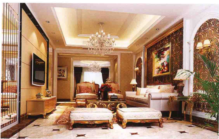
沙发墙：墙纸 + 石膏罗马柱