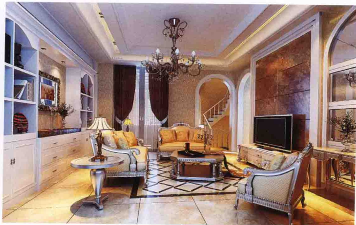
沙发墙：墙纸 + 饰面板装饰柜