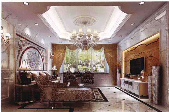
沙发墙：艺术墙砖 + 大花白大理石