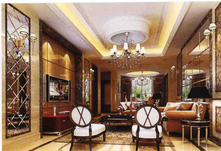
沙发墙：银镜倒角 + 墙纸 + 啡网纹大理石线条收口