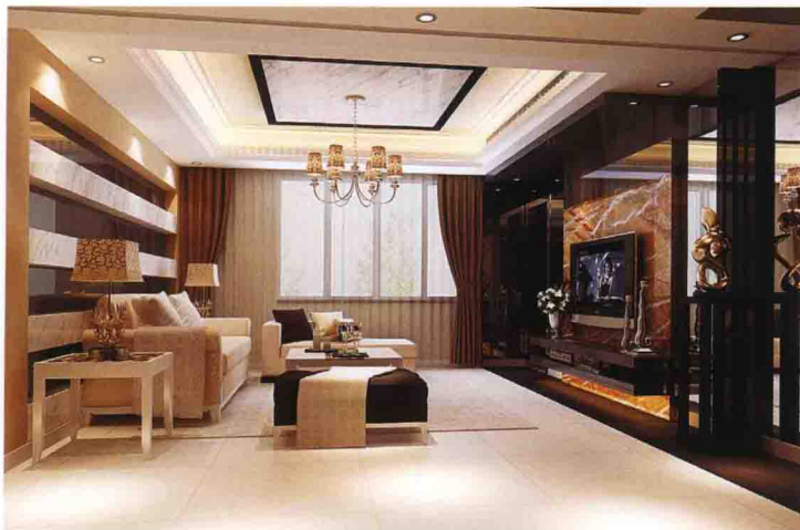
沙发墙：灰镜 + 大花白大理石 + 墙纸