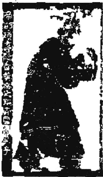
山东嘉祥武梁祠画像石上的颛顼，表现的是颛顼奉玉事神的形象。

视同仁’的。” ① 在这种情况下，每个氏族成员都有与神灵直接对话和沟通的权力，因而出现了“夫（人）人作享（祀），家为巫史”的局面 ② ，人人都可以供奉自己所信奉的神灵，每个家族都以家族成员为通神的巫覡。在原始宗教的后期，随着社会财富的增加，私有财产的出现，氏族成员之间不可避免地出现了贫富分化；随之而来的是，人与人之间的平等关系也被阶级对立所取代，原始宗教的民主性和平等性随着社会经济关