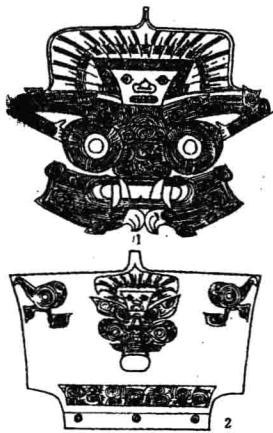
良渚文化玉雕神像

从70年代开始，在江苏省吴县草娃山、张陵山、常州寺墩、武进郑陆以及上海福泉山等地的良渚文化遗址，还出土有大量的玉琮、玉璧等祭祀用玉器。琮璧是古人祭天地的瑞玉，《周礼·大宗伯》中有“以苍璧礼天，以黄琮礼地”的说法。这说明当时人们除了用玉制作神灵偶像外，还以玉器作为宗教祭祀的祭品。