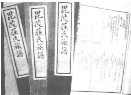
《毗陵庄氏宗谱》25卷，1926年铅印本

迁入常州的庄姓可以说是顺风顺水，数百年来入仕者、从医者、文学家、书画家，已难以准确统计。自从宋熙宁三年（1070年）庄谊成为常州庄姓首名进士以后，常州庄姓大约出过举人一百十五名，进士四十六名，状元一名（庄培因），榜眼两名（庄