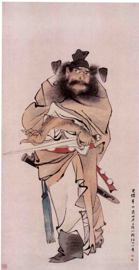
《钟进士像》清·任伯年

画面中的人物服饰也可以用色来辅助表现，淡色也不宜过多，可根据画面需要来定。色是墨的辅助表现，颜色不宜过重，以免破坏画面中的笔墨关系。衣物着色时注意颜色要薄、透明，水分要足。