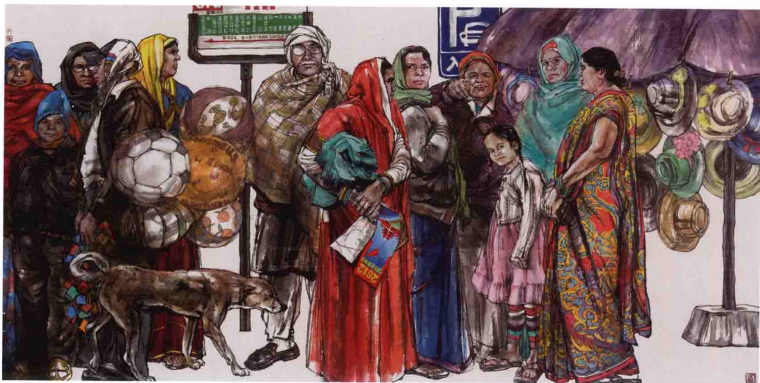
《魅力北京》（局部） 张建豹

写意着色是写意人物画中常见的表现形式，是在写意线描的基础之上进行笔墨方法的训练，但重点放在写意人物的用色技法上，包括国画颜料的性能，用色的技巧和艺术，色墨混用时色与墨的协调、对比等。最初学习着色可先从着色兼工带写开始入手，然后逐渐放开用笔进入一般的意笔着色。着色方法也可以从淡彩开始，循序渐进到重彩。