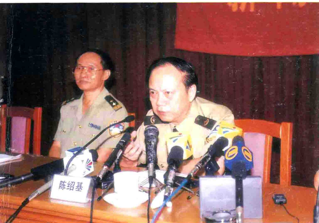
广东省委副书记、公安厅厅长陈绍基介绍案情