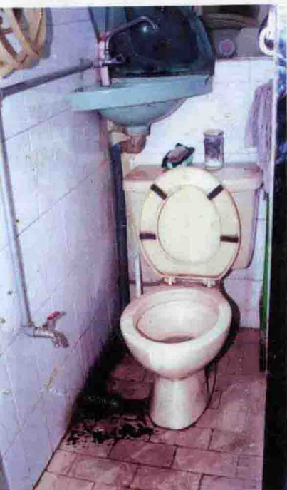
叶继欢1300多万赃款藏在汕尾祖屋， 一个洗手间的地板下面