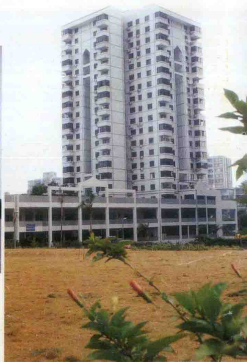
张子强团伙成员用赃款在此购买了商品房