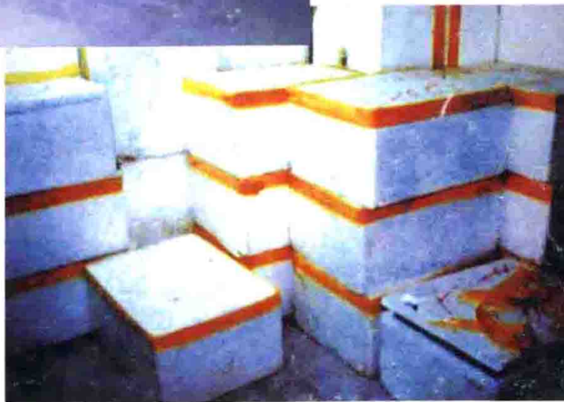
从汕尾偷运到香港的800余公斤炸药以及雷管、导火索，成为香港安全的巨大隐患