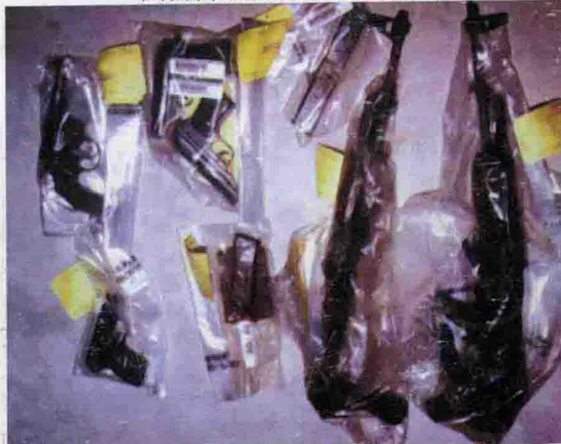
在深圳等地缴获的犯罪团伙作案的枪支