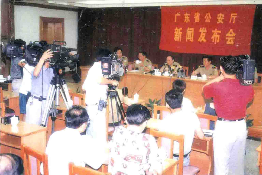
广东省公安厅的新闻发布会现场