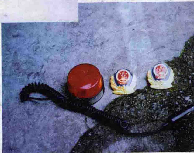
缴获张子强犯罪团伙冒充警察所用装备