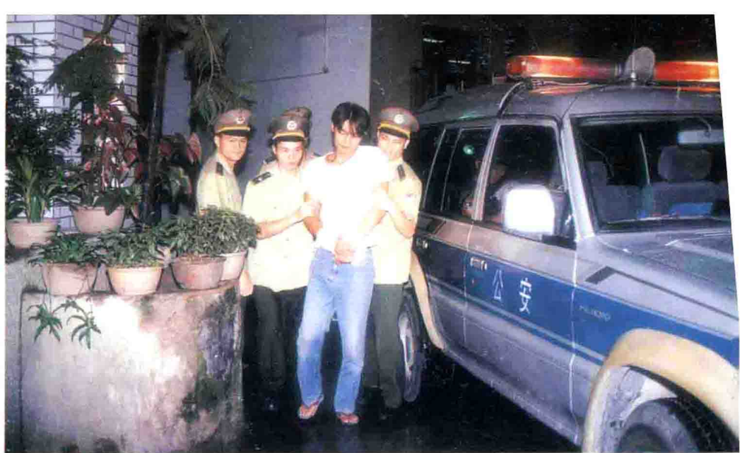
这是广州松林山庄别墅，张子强团伙成员购买的物业