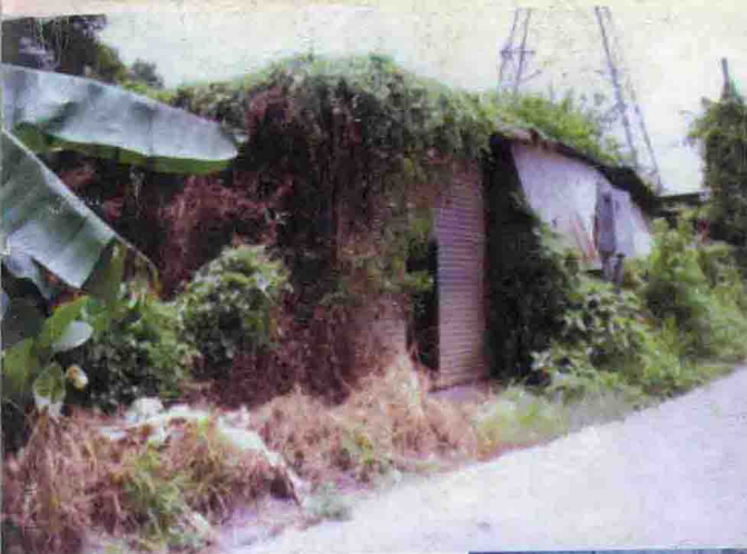
1998年1月17日被警方在新界马草垄查获的炸药房