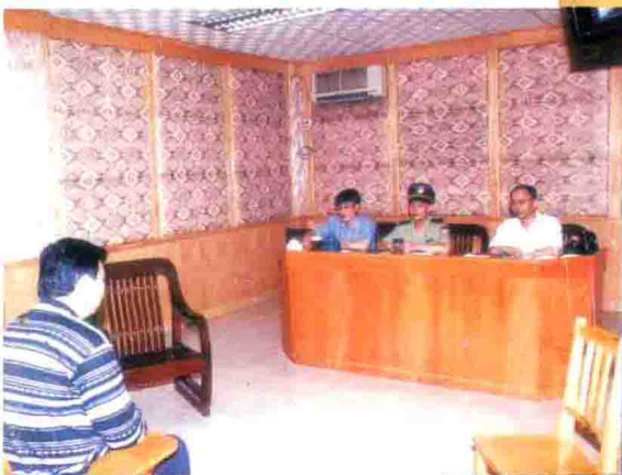
预审室里面，对张子强团伙案犯进行预审