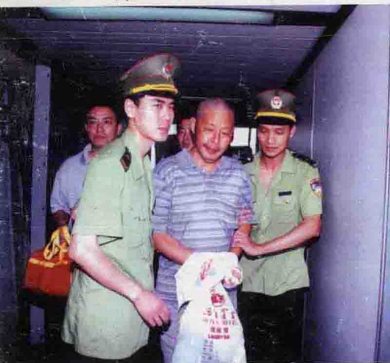
张子强犯罪团伙成员被抓获