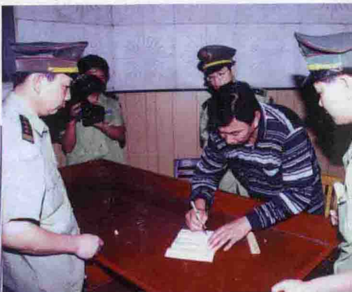
从厦门抓回的案犯