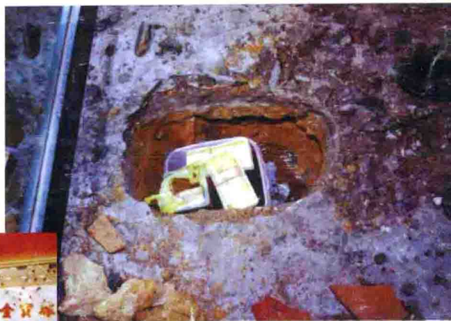
在张子强团伙成员家中的混凝土地面下挖出赃款1370万港元