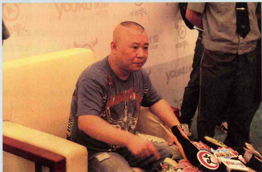
郭德纲在接受媒体采访。