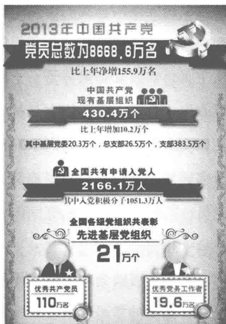
2013年党员总数为8668.6万名

实践表明，党员素质高低，分布结构是否合理，直接影响着党员队伍的整体素质，影响着党的创造力、凝