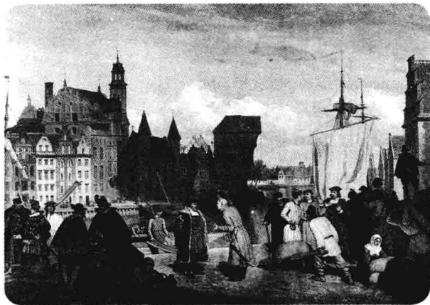
▲ 城市里贸易日益兴盛

这座特殊的城市也有自己的城墙，在城门口站着看守人，同时还有木头做成的栅栏。门口的看守人小心地看着集市里的人们，以防止他们不纳税偷偷溜走。在集市开张的时候，宫廷传令官身上穿着金绣的长襟外衣，手里拿着金色的权杖。当宫廷传令官大声地宣布集市开张时，法官将会在门口接过钥匙，然后在集市上绕行一周。