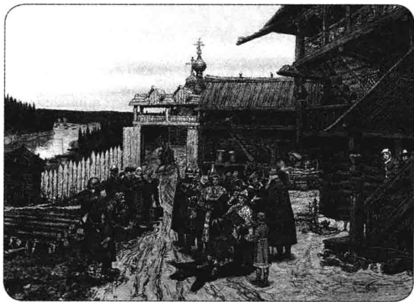
▲ 在 13 世纪初，莫斯科不过是俄罗斯中部无边森林中的一座木造小城

王公们破坏整个俄罗斯团结一心的计划从柳别奇回去的路上就已经开始了。莫诺马赫的兄弟们也在思索要如何夺取他们的侄子罗斯齐斯拉维奇 1 的土地。