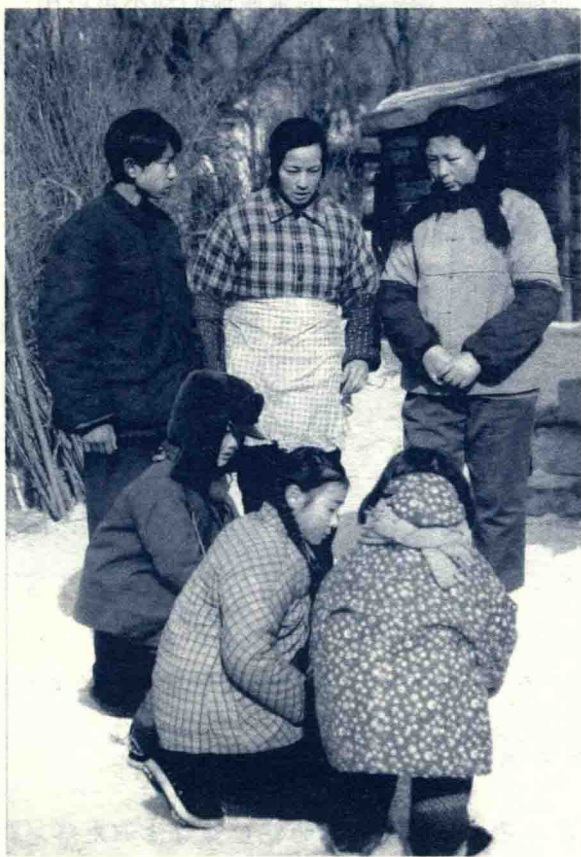
《我的兄弟姐妹》剧照

兄弟姐妹这种同胞的手足之情，甚至开始怀疑这种亲情是否存在。古人云：“人不可无群。”在我们的大家庭中，对兄弟姐妹要以礼相待，相互尊重关爱。因此，我们在和兄弟姐妹相处时首先要尊重对方；其次要对兄弟姐妹怀有一颗真诚的心；再者要懂得谦让，要对兄弟姐妹宽容，不斤斤计较。