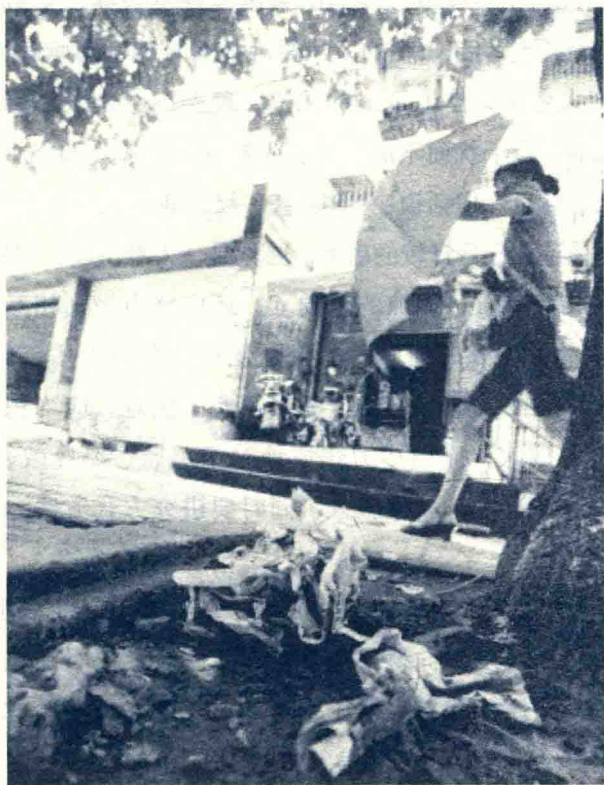
楼上扔下的垃圾，让楼下的邻居不堪其扰