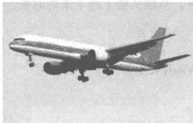
上图为154客机图片，下图为波音757-200货机图片

法官：“这个不幸事件重创了你的生活。你说过，它把你的生命推到了尽头。是这样吗？”