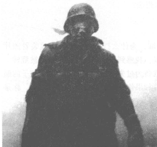
反映中国军人作战的绘画作品