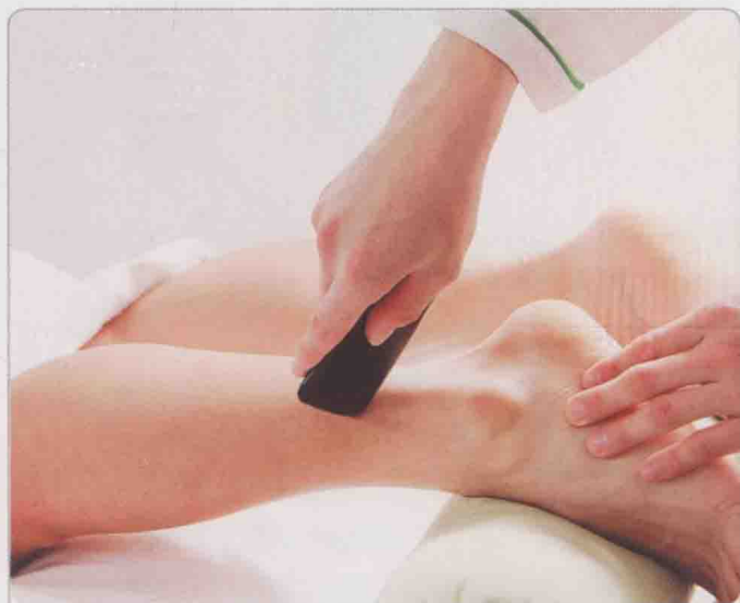
穴位的远治作用，即指通过对特定穴位进行刮痧，有助治疗穴位所在经络和相表里经络的疾病。

经穴，顾名思义是经络之穴，这也就指明了经穴主治与经络之间的关系。经穴的远治作用与经络的循行分布是紧密相连的，穴位在远治作用中除了能治疗本经病变以外，还能治疗相表里的经脉疾患。例如，手少阴心经上肘以下的穴位，一般都能预防和治疗心血管系统、神经系统等部位的疾病，