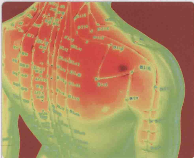
经络是气血的通道，保持经络通畅，才能保证身体健康。

在传统医学理论当中，经络理论可以说是最独特、最神奇、最源远流长的一部分。历代医家都对经络的使用推崇备至。对于治疗疾病和预防保健，经络和各种穴位堪称是蕴含在人体内的金矿，从中挖掘出的金子数也数不清。在医疗技术相当发达的今天，经