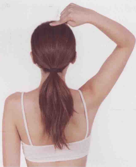
百会穴在清气下陷时可以提升清气，在肝阳上亢时可以平肝潜阳。

针刺某些穴位，对机体的不同状态可起到双向的良性调节作用。如百会穴，在清气下陷时可以提升清气，在肝阳上亢时可以平肝潜阳；内关穴可使心动过缓者加快心跳，心动过速者减缓心率；合谷穴在解表时可以发汗，在固表之时又能止汗等。另外，有些