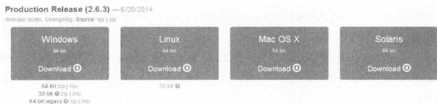
图 1-2 各平台二进制分发包

MongoDB 官方已经提供了 Linux、Windows、Mac OS X 以及 Solaris 4 种平台的二进制分发包，最新的稳定版本是 2.6.3，下载地址是： http://www.mongodb.org/downloads ，如图 1-2 所示。