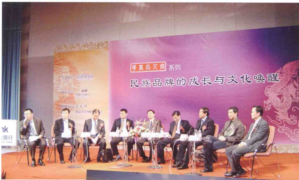
作为嘉宾，出席各种论坛