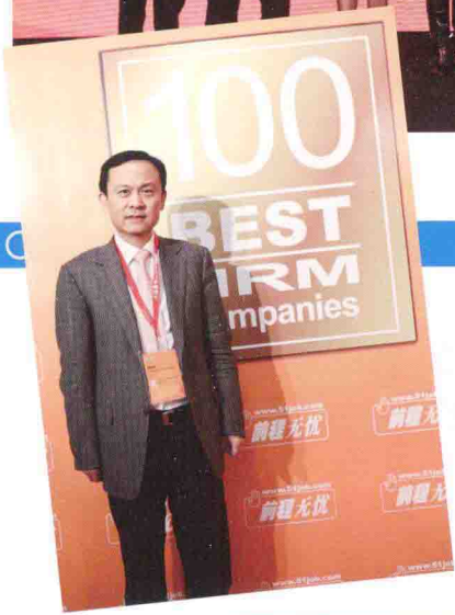
中国最佳人力资源典范企业评选评委之一