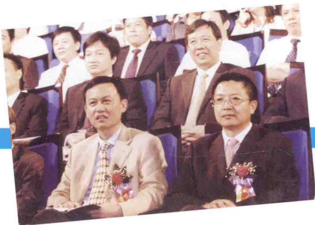
担任《绝对挑战》评委嘉宾