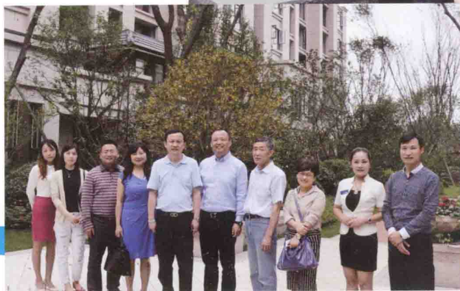
与新顺恒地产管理团队合影