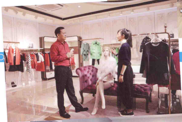
与伊舍服饰公司罗总及管理人员合影