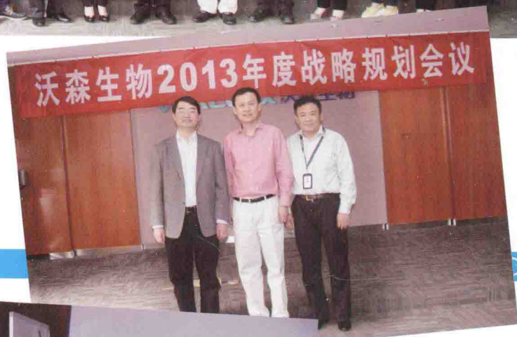
担任云南沃森生物咨询顾问