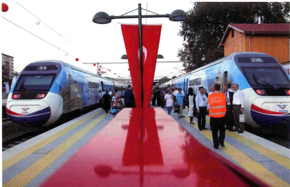
2014年7月25日安伊高铁通车仪式当天，停靠在站台两侧的列车