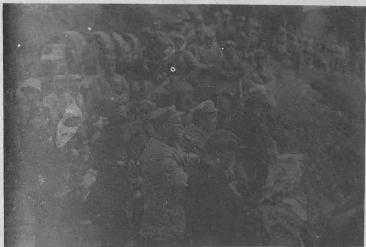
1949年10月,刘伯承率部从武汉经长沙向大西南进军。这是在铁山渡口准备渡河的情景。