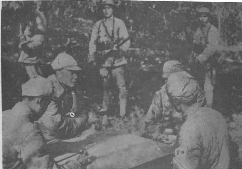
1949年12月25日，国民党军第七兵团司令裴昌会率部在成都以北之德阳起义。这是裴昌会（右二）起义后见贺龙司令员（左）。