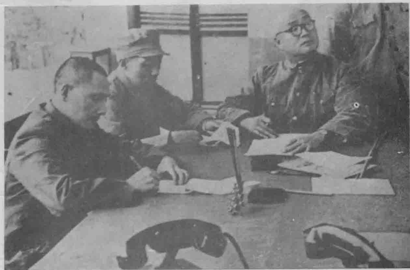
刘伯承司令员(右)、邓小平政委(左)、张际春副政委(中)在第二野战军指挥部。