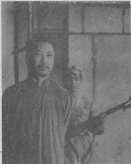
战争罪犯、国民党四川省主席王陵基。 1950年2月6日，川南军区部队在江安捕获