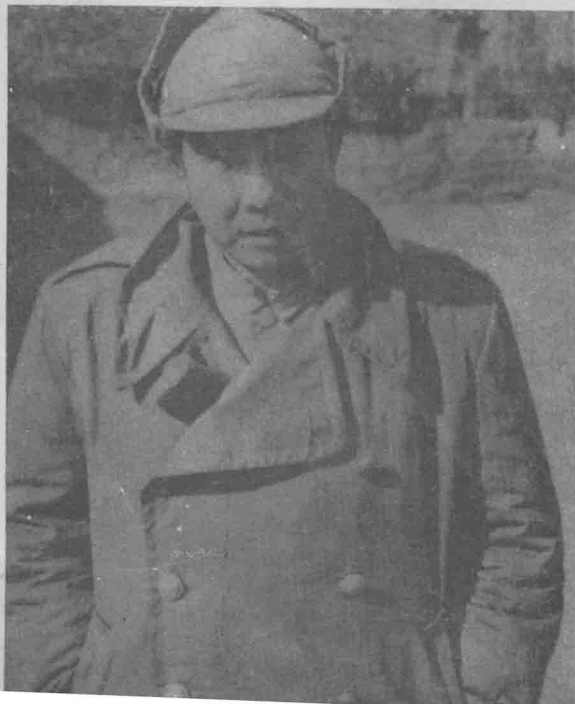
这是被我俘虏的战争罪犯、敌第五兵团司令李文。