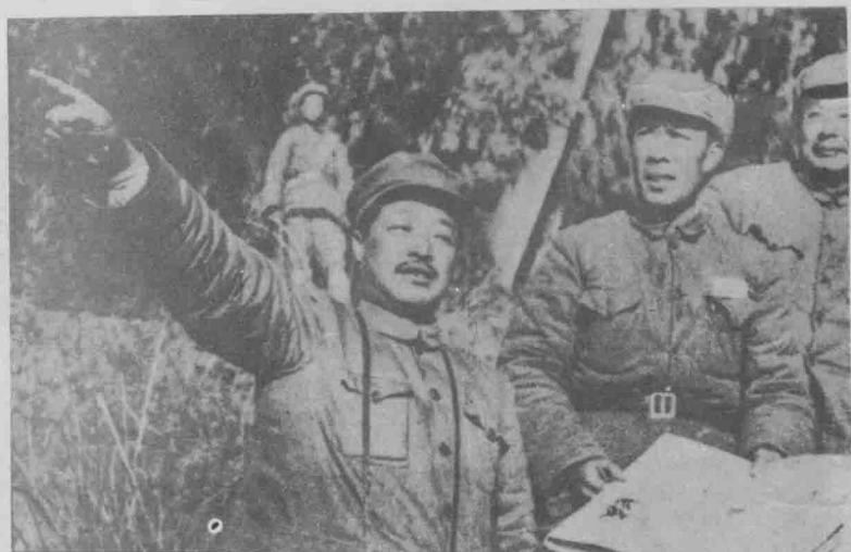
1949年11月,根据中央军委命令,贺龙、李井泉同志率领第一野战军第十八兵团等部进军西南,首先将胡宗南集团抑留在秦岭地区。后由陕入川,占领了川北和成都地区。这是西北军区司令员贺龙(左一)、副司令员王维舟(左三)和第十八兵团司令员兼政