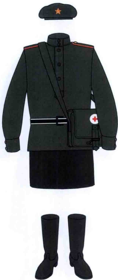
二战时期的女兵服装