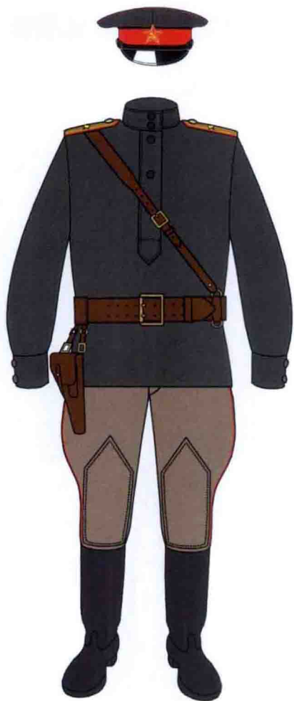
二战时期的校、尉军官战斗服装