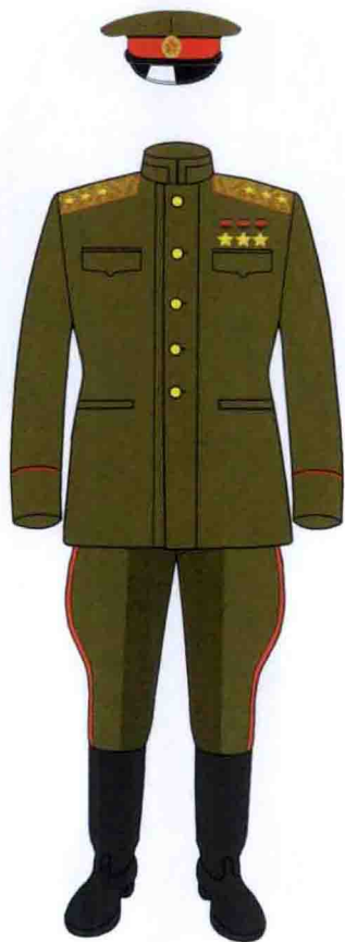
二战时期的将官制服