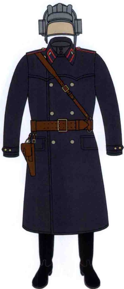
二战时期的坦克乘员服装