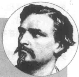
弗雷德里克·米斯塔尔