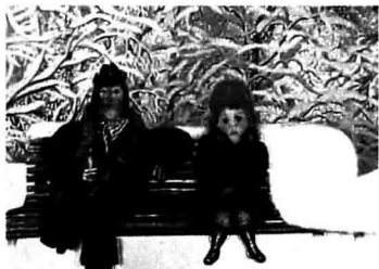
《故事里的故事》(俄罗斯)