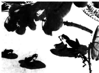
《小蝌蚪找妈妈》(中国)