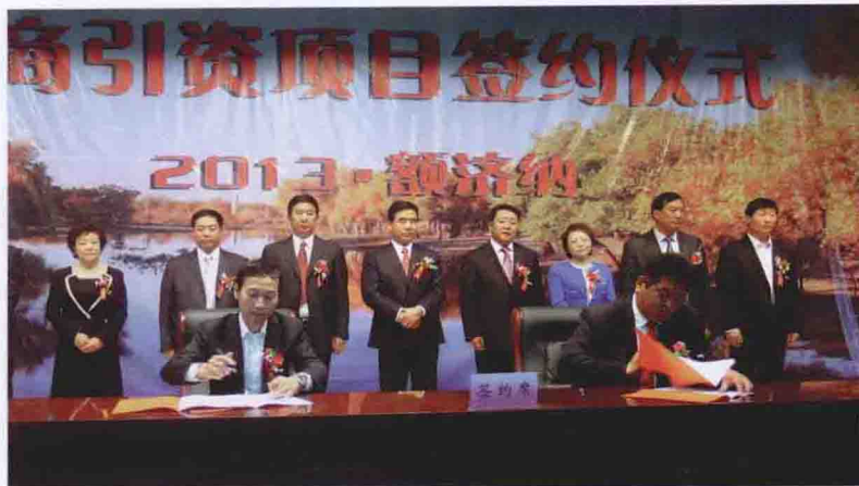
额济纳旗居延文化城招商引资项目签约仪式