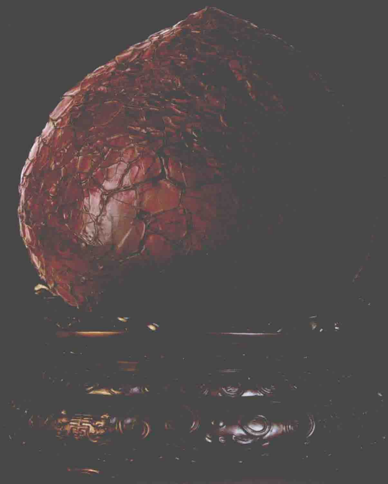
题名：寿桃 石种：彩玉 尺寸：18×18×12cm 收藏：田 殷