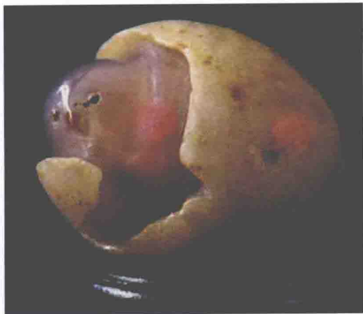
▲ 题名：小鸡出壳（左） 石种：玛瑙