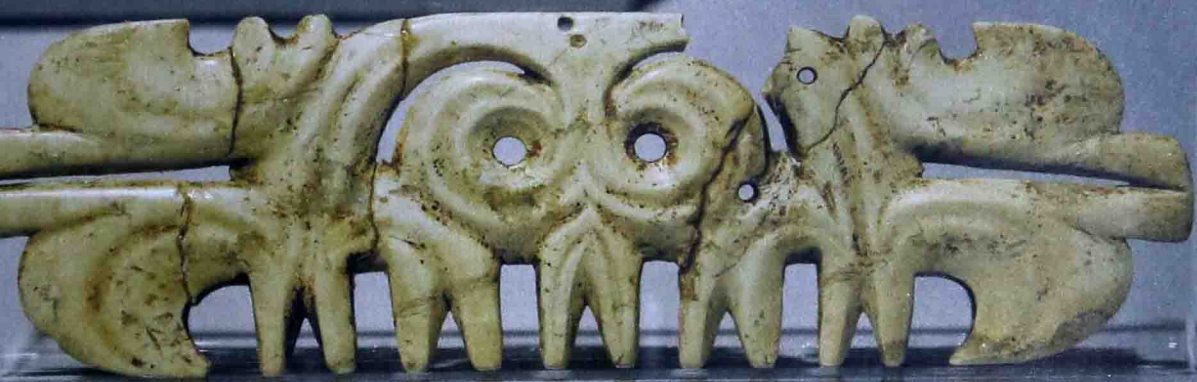
◆牛河梁出土红山文化神鸟展翼形玉牌，2012年摄于红山文化精品展

人类关于自身的认识经历了漫长而曲折的历程。人类文明是如何起源的问题，就属于迄今为止尚未完全解决的重大学术难题。而在世界五大洲的各个文明古国中，大部分文明都先后走向衰落和毁灭，没有能够将其古老传统遗留到后世。唯有一个东亚文明数千年未曾中断地发展至今天，那就是中华文明。为什么中华文明能够在全球的文明古国中出类拔萃地延续其生命呢？这个文明又是怎样起源的？有哪些发生学的特质能够赋予这个文明与生俱来的可持续优势呢？这就是本书所要考察的主题——中华文明发生史所能透露出的文化奥秘。