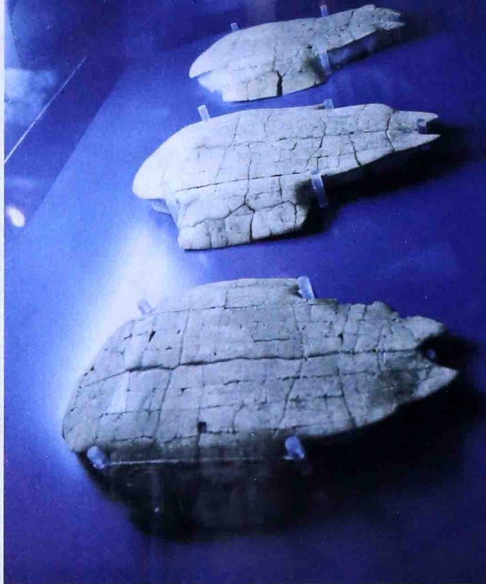
◆ 北京山顶洞人复原像，2009年摄于山顶洞博物馆 ◆ 甲骨文的发现，摄于安阳殷墟博物院