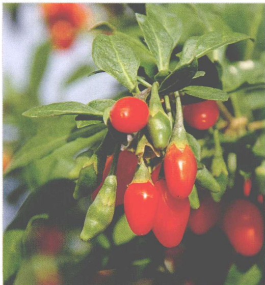
● 中华枸杞是中国地区最常见的枸杞品种，一般多为分枝灌木，高0.5~1米，浆果呈卵状。

中华枸杞的花在长枝上单生或2个并生于叶腋，在短枝上与叶簇生；花梗长1~2厘米，向顶端逐渐增粗。花萼可长3~4毫米，通常3~4齿裂，裂片有少许缘毛；花冠呈漏斗状，长9~12毫米，呈淡紫色，筒部会自下而上变粗，近似于檐部裂片，裂片呈卵形，顶端圆钝，稍向外反曲，边缘有一些缘毛；雄蕊比花冠短一些，其花丝在近基部处密生一圈绒毛并交织成椭圆状的毛丛，与毛丛处的花冠筒内壁生出一些