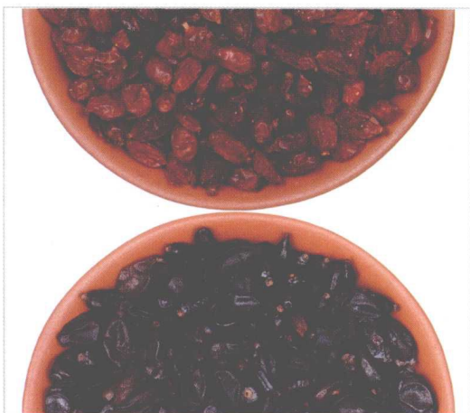
● 黑果枸杞含有丰富的黑果色素——天然原花青素，因此被誉为野生的“蓝色妖姬”。

黑果枸杞多分布于我国内蒙古西部、宁夏、甘肃、青海、新疆、西藏、陕西北部，常生于河湖沿岸、干河床、高山沙林、盐化沙地、荒漠河岸林中，为我国西部特有的沙漠药用植物品种。