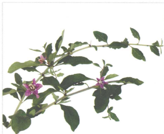
● 中华枸杞的花呈淡紫色，在长枝上单生或2个并生于叶腋，在短枝上与叶簇生。

中华枸杞一般多为分枝灌木，高0.5~1米，栽培时可长到2米多；枝条一般较为细弱，弓状弯曲，呈淡灰色，有纵条纹，棘刺长0.5~2厘米，生叶和花的棘刺较长，小枝顶端锐尖成棘刺状。