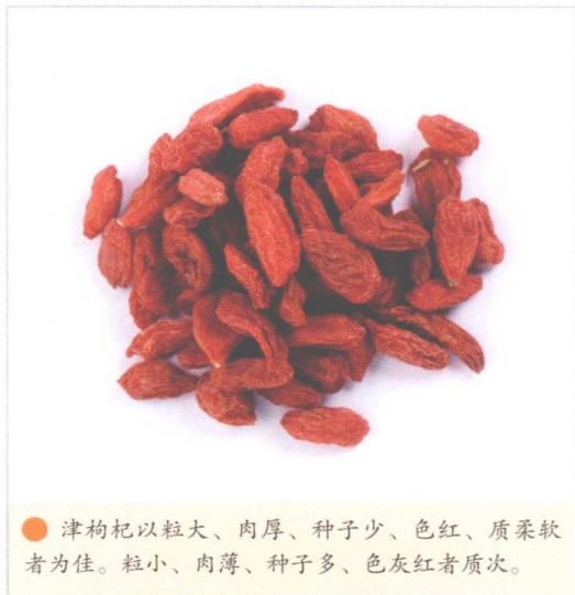
● 津枸杞以粒大、肉厚、种子少、色红、质柔软者为佳。粒小、肉薄、种子多、色灰红者质次。

津枸杞是植物枸杞的干燥成熟果实。呈椭圆形或圆柱形，两端略尖，长1~1.5厘米，直径3~5毫米。津枸杞表面鲜红色或暗红色，具不规则的皱纹，无光泽。质柔软而略滋润，内藏多数种子。无臭，味甜。