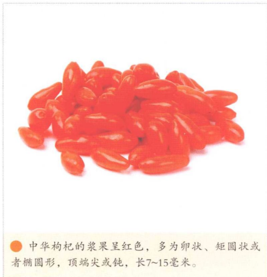
● 中华枸杞的浆果呈红色，多为卵状、矩圆状或者椭圆形，顶端尖或钝，长7~15毫米。

中华枸杞的浆果呈红色，长7~15毫米，直径可达5~8毫米，多为卵状、矩圆状或者椭圆形，顶端尖或钝。其种子呈扁肾形，长2.5~3毫米，黄色。花果期一般为6~11月。