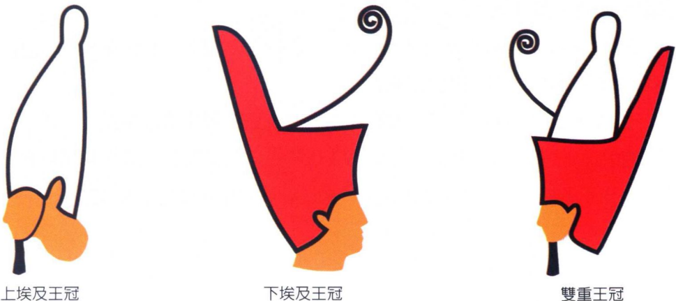
圖 1-3 上圖為上埃及王冠；圖中為下埃及王冠，圖下為雙重王冠，象徵上下埃及統一。

西元前 2900 年出現在尼羅河流域的納莫（Narmer，人名），可能就是傳說中的美尼斯（埃及的武士），他成功的統一了上、下埃及。後來他自立埃及的第一王朝。由於他身居一國之首的地位，納莫的權力至高無上，在他的服裝和配飾上充分顯示出這一點。最明顯的是納莫的冠式，他有權享用兩頂王冠，即上埃及王冠和下埃及王冠。上埃及的王冠為白色，其高大的外形很像一個立柱；下埃及的王冠是用柳條編織的紅色平頂王冠，冠頂後側向上凸起，形成後高前低的立柱形（圖 1-3）。