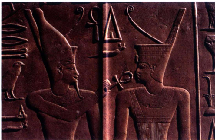
圖 1-1 為「卡那克—地塞努斯雷特一世白禮拜堂的浮雕（局部）」。據傳統上埃及為白色高大的王冠，外型很像一個立柱；下埃及為紅色平頂柳條編織的王冠，冠頂後側向上凸起，也呈細高的立柱形。圖左的王冠為雙重王冠，象徵上下埃及統一；圖右的王冠為下埃及的王冠。

據傳統說法，完成埃及統一事業的是一位來自南方上埃及的武士，他叫美尼斯（又稱納莫），是第一位把北至尼羅河三角洲的整個埃及都置於自己控制之下的國王，當了第一名法老，配雙重王冠（象徵上下埃及統一，如圖 1-1 的法老），日後歷經 30 個王朝，至西元前 525 年被波斯所滅，歷史上稱這一段歷史為古埃及時期。據分析，古埃及人可能是一支已滅絕的地中海民族，不是白種人及黑種人，雖有這樣的判斷，但是對於他們的屬性至今仍未清楚。古埃及文明雖有深遠的歷史，可惜自羅馬時期之後漸被湮沒，不久之後，這個文明已經完全被終止了，連同相關的文字典章也沒有保留下來，今天所知有關埃及的事蹟，大體是埃及學者