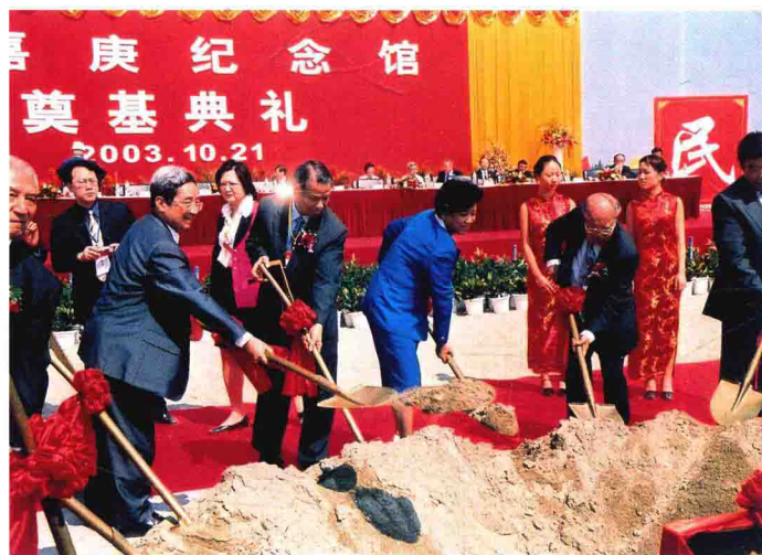
参加集美学村的校庆活动