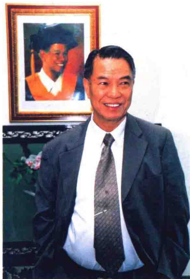
画里画外一样的微笑