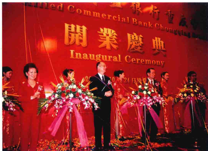
新联银行重庆分行开业典礼

1984年，陈永栽率团赴北京参加中华人民共和国35周年国庆典礼，买下了菲律宾电视台的黄金时段，转播中国改革开放总设计师邓小平主持的国庆阅兵典礼盛况。他迄今仍珍藏着一份《人民日报》剪报，上有1994年3月30日的一则新闻，标题为《江泽民乔石分别会见菲华商联总会考察团》，这是商总首次组团访问中国大陆。1997年，陈永栽以指导员身份率领商总考察团第二次访华，获江泽民接见，还走访了中国沿海经济特区；2000年3月，以团长身份率领