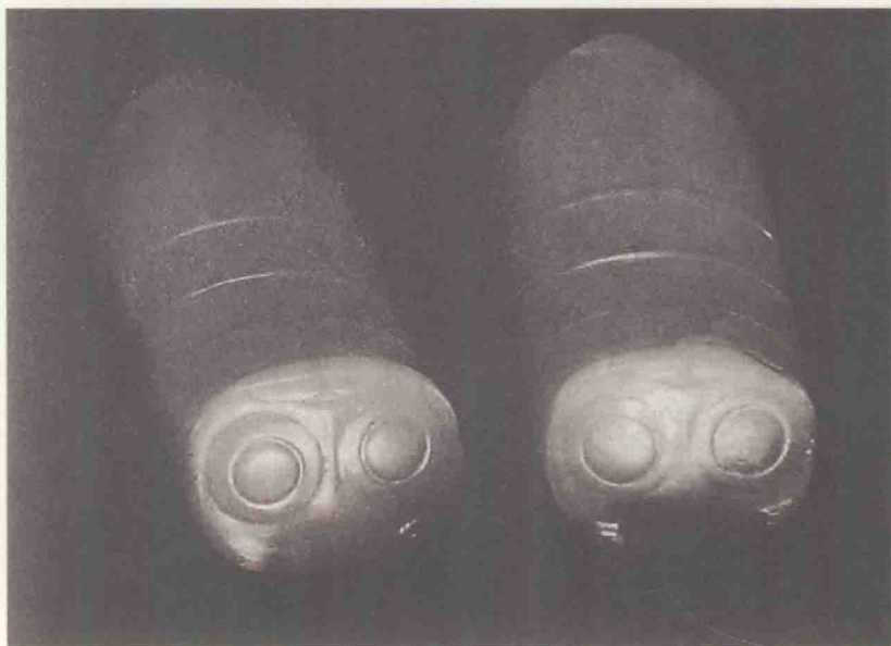
陶蚕蛹（选自《文物》杂志）

现出土了一批四千七百年前的丝织品，有未炭化而呈黄褐色的绢片，已炭化但仍有韧性的丝带、丝线等，经鉴定为家蚕丝。1960年，在山西芮城县西王村仰韶文化遗址晚期地层发现了陶蚕蛹。石蚕和陶蚕蛹是原始社会对蚕产生巫术崇拜的见证，商朝以后历代都有王宫祭祀蚕神的风俗。这一切都证明中国黄河、长江流域先民经长期采用野蚕丝的实践，至新石器时代晚期已成功将野蚕驯化为家蚕，养蚕历史至今长达四五千年。