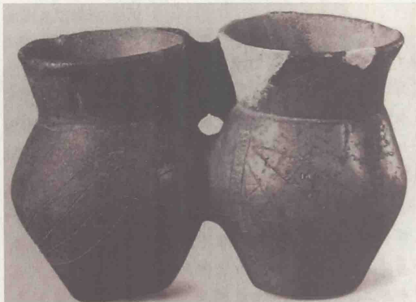
两千二百年前的蚕形昆虫双联陶罐

中国是世界上最早开启蚕桑文明的国家。1921年，瑞典人安特生（Anderson）在辽宁沙锅屯仰韶文化遗址发现了大理石蚕。1927年，在山西夏县西阴村灰土岭遗址发现了距今四千多年的半割切蚕茧，品种与桑蠶茧近似。1958年，在浙江湖州钱山漾新石器遗址发