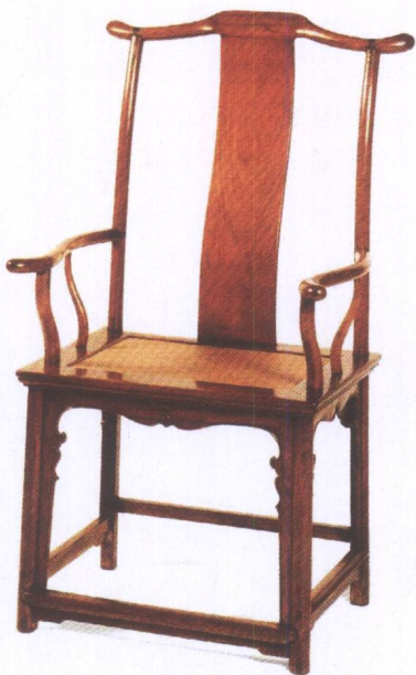
图7 明式四出头官帽椅，作为明式家具的典范之作，该椅整体浑然天成，和谐庄重。横平竖直的交接之间又有弧度自然的搭脑、靠背、扶手、联邦棍，线面处理得当，对比丰富，给人一种秩序感和层次感。