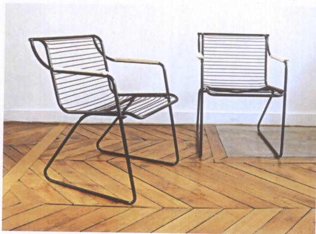
图8 该休闲椅既有造型的变化，又有材质和表现语言的统一。