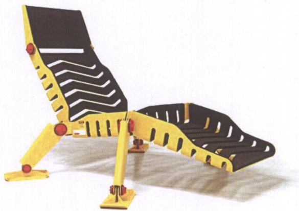
图6 金属件连接结构家具