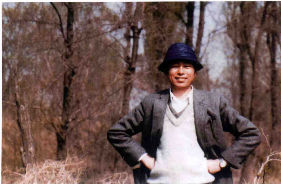
1989年春，黄一鹤在电视艺术片《远方的旋律》拍摄现场