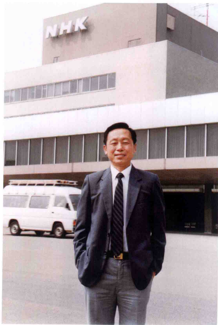
1992年春，黄一鹤赴日本进行电视业务考察