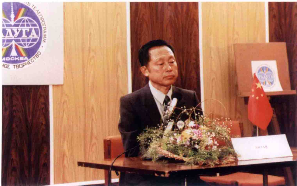
1994年6月，黄一鹤访问俄罗斯，担任彩虹电视节评委