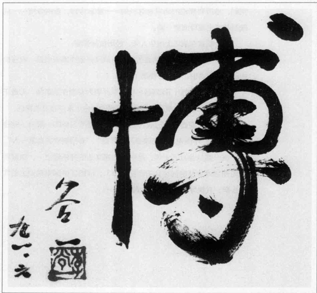
著名歌唱艺术家李谷一为黄一鹤题字：博