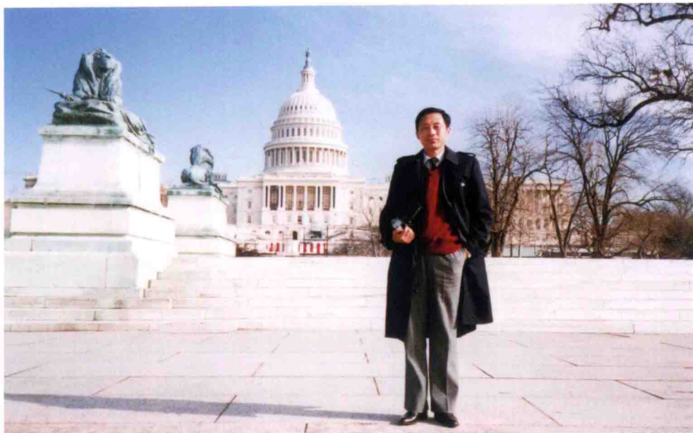
1989年1月，黄一鹤赴美国进行电视业务考察