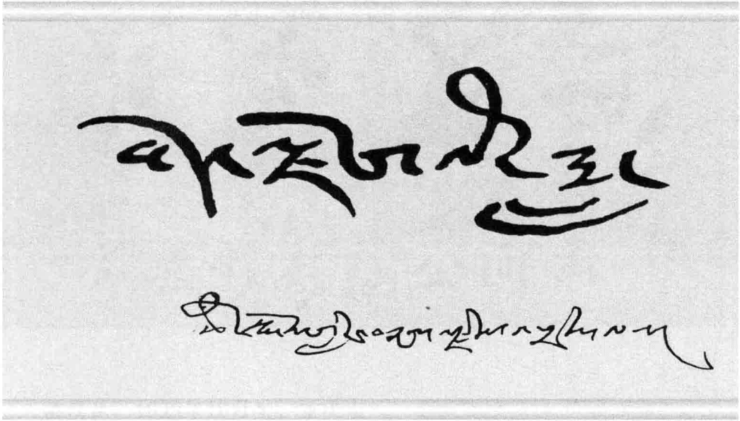
西藏岁月——策墨林·单增赤列题字

策墨林·单增赤列，男，藏族，1950年9月生，西藏拉萨人，无党派人士，1956年10月参加工作。现任政协第十届西藏自治区委员会副主席，第七届、八届、九届、十届全国政协委员。